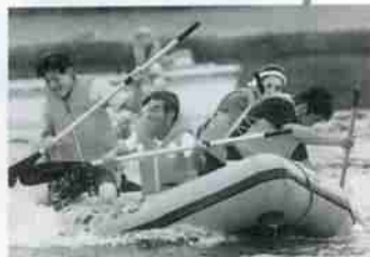
▲昨年の登別漁港まつり

◆ふるさとふれあい農園収穫祭(青葉小学校)◆24時間バドミントンフェスティバル◆登別漁港まつり◆北海道クロスカントリーレース・大地の祭典◆いぶり民謡歌合戦◆富士橋完成◆NPO法人『いぶりたすけ愛』の活動(全15分)