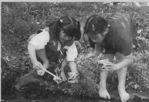
▲昨年のジャブジャブ川金魚すくい

緑豊かな市民憩いの場、亀田記念公園で、『第5回ラブグリーンフェスティバルin KAMEDA』を開催します。家族、近所のみなさんおそろいでお越しください。