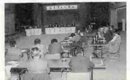
▲平成4年4月に開かれた「CIフォーラム」

CI運動をこのように見たとき、いま、市が進めている新しい総合計画づくりの「市民みんなで理想