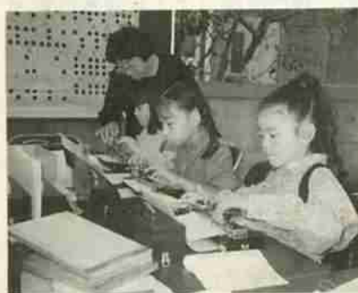
去年のふれあい広場での実技講習風景