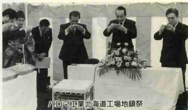
パロマ工業北海道工場地鎮祭

パロマ工業は、平成三年四月、現地法人のパロマ工業北海道工場を設立。室蘭市東町の仮工場で、従業員百二十人体制でコンロの点火装置などの部品製造と組み立てを行ってきましたが、現工場が手狭なため、昨年七月国道三十六号線に面した旧富士工業跡地のほぼ