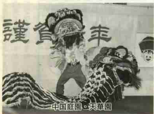
中国庭園・天華園

穏やかに明けた「とり年」。昨春オープンした登別伊達時代村と中国庭園・天華園は初めてのお正月を迎えました。 登別伊達時代村では、「お正月まつり」として、振る舞い酒や富くじサービスの特別イベント。 中国庭園・天華園では、中国芸術団の京劇、舞踊、気功術などを