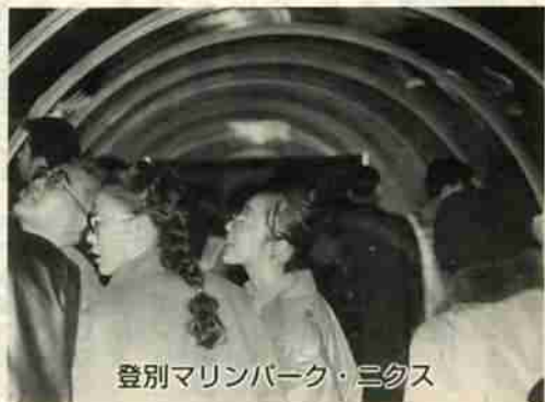
登別マリンパーク・ニクス

披露し、五重の塔では「初大声大会」や新春にちなんだ「ジャンボ福笑い」などの催しが行われました。 また、先輩の登別マリンパーク・ニクスも振る舞い酒とお汁粉のサービス、しにせのクマ牧場ではクマのかわいいショー。 訪れた入場者は心ゆくまで楽しんでいました。