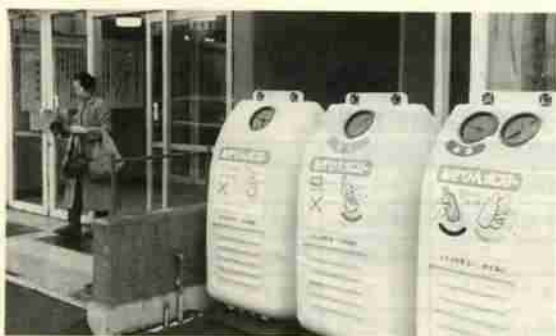
市役所正面玄関に設置されたあきびんポスト