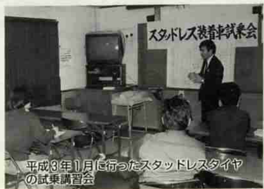
平成3年1月に行ったスタッドレスタイヤの試乗講習会

市が主催しての、スタッドレスタイヤの試乗講習会などを昨年、一昨年に引き続き今年も実施しています。