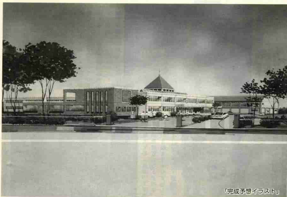
「完成予想イラスト」

さらに、一部教室の壁はスライディングウォール（動く壁）を用い、教室の面積を目的に応じ柔軟に変更することができます。