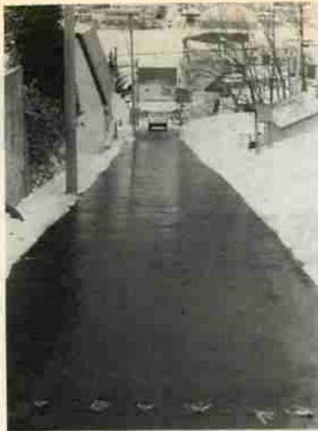
→鋼製パイプから水が流れ路面が露出していきます