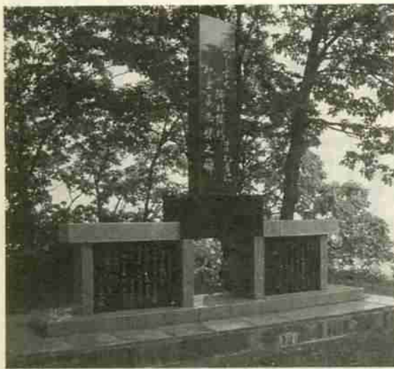
落ちついた雰囲気の中にある知里真志保記念碑

博士は、明治四十二年登別に生まれ東京帝国大学を卒業。アイヌ語の言語学的研究を志し、アイヌ