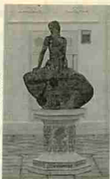
海洋ファンタジー館内の人魚姫の像

登別マリナーパークは、市が登別漁港周辺とフンベ山周辺を都市公園として整備し、その整備区域内で市などが出資する第三セクター、株式会社北海道マリナーパークの事業として建設しているものです。