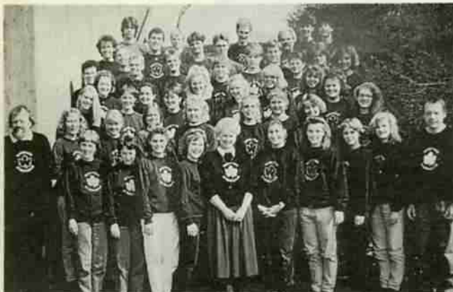
▲デンマークミッドフュンズ高等学校合唱団の皆さん

文化庁移動芸術祭歌舞伎公演(出演…尾上菊五郎、市川佐団次、坂東彦三郎 他) ▶日時 10月31日(水) 昼夜2回公演 昼…午後1時、夜…午後6時 ▶場所 市民会館 ▶入場料 A席…4,000円、B席…3,000円、C席…1,500円(予定)