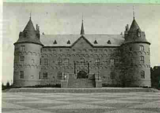
▲デンマークの古城「イーエスコー城」をモデルにした「ニクス城」。1万匹の魚たちがマリナーパークの世界へいざないます。

「北欧ロマンと海洋ファンタジー」をテーマに北欧の古城を中心とした街並の再現と、光と魚達の演出による幻想的な世界の演出をめざしています。メイン施設となる「ニクス城」は、デン