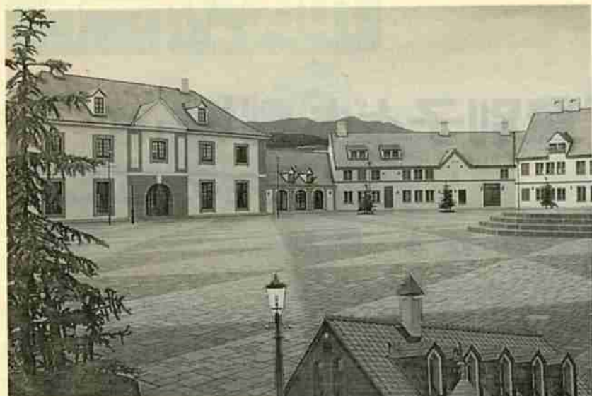
▲北欧の街へ来たような錯覚を起こしてしまう「ニクス広場」