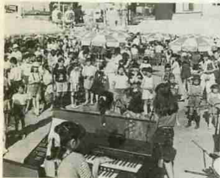
昨年のお祭り風景

市は、今年も暴力追放運動を更に強力に推しすすめるため、お祭りから暴力団とのつながりのある露店を締め出すこととしました。