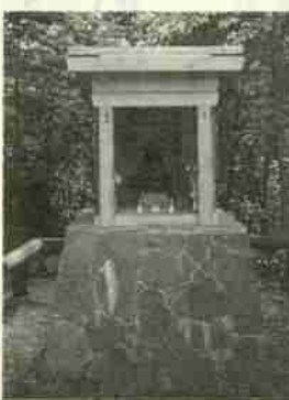
登別郷土文化研究会 宮武 紳一

アイヌ語のクスリエサンベツ(葉湯・そこを・出てくる・川)、(ア)クユ(われら・飲む・温泉)、シツカルユ(目を・治療する・温泉)などと呼称される地名ももうなづける。明治三十八年(一九〇五)日露戦争の負傷兵療養所として陸軍省の指定を受け医療との関係も深い。