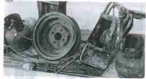
〈焼却炉から出た危険なガスボンベなど〉

市民の皆さん一人ひとりがゴミの分別と減量について認識を深めていただくことが経費の節減につながります。ご理解とご協力をお願いします。