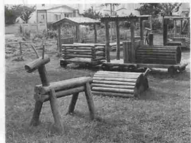
楡の木公園や中央公園、わかば公園など地域の暖い手で大切にされている公園も数多くあります。写真は中央公園

最近、トイレへの悪質ないたずら書きや芝生を傷めるような行為があとを絶ちません。市内に100カ所以上ある公園も、このようなことがあつては維持するのも大変です。公園は地域に住む皆さん、利用する皆さんの手で愛情をもって育てましょう。