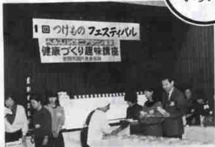
▲つけものフェスティバル