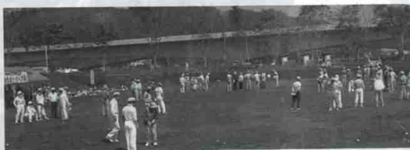
毎年、多くの催し物が行われる川上公園

最近、市が実施した「あなたが選んだ」まちづくりベスト10の中には、第2位に「亀田記念公園」7位と8位に「若草中央公園」「川上公園」がそれぞれ入っており、公園はまちづくりに欠かせないものとしてますます重要になっています。