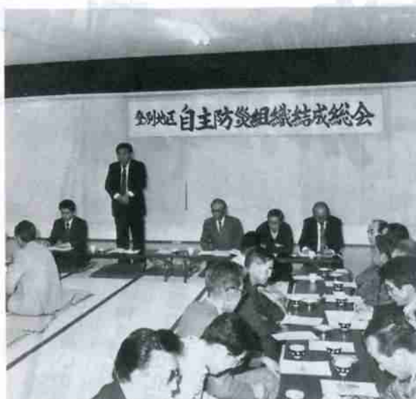
4月30日に行われた自主防災組織の設立総会