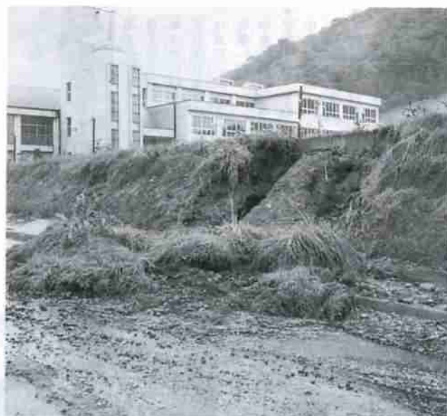
8月26日の大雨で被害をうけた登別温泉中学校

▼十一月答申予定 九月十一日、第一回に引き続き開かれた審議会で、市側の計画案説明が行われた後、総括的な質疑が行われました。審議会は今後、各部会の細部協議を経て、十一月上旬答申案を作成する運びとなります。