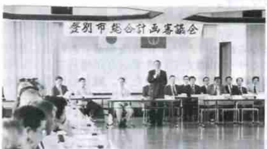
登別市総合計画審議会