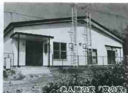
老人憩の家「夏の家」