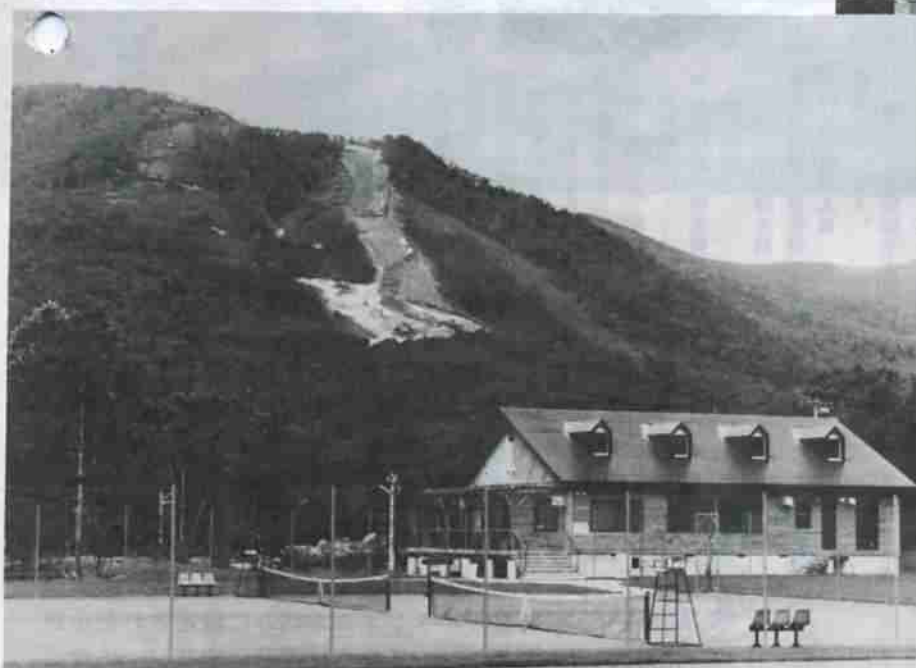
カルルス・サン・スポーツランド