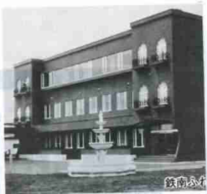
鉄南ふれあいセンター