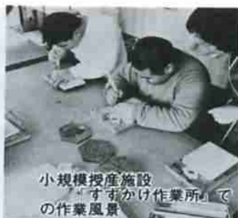
小規模授産施設「すずかけ作業所」での作業風景

長い年月、社会の発展に寄与されてきたお年寄りの方々に、健康で幸せな生活を送っていただくことは私たちの願いです。58年4月には特別養護老人ホーム「緑風園」が完成、豊かな緑に囲まれた環境の中で万全の看護を受けながら療養生活を送っています。また、39ヵ所の老人憩の家を通じて各種の活動が毎日のように行なわれ、お年寄りの笑顔がたえません。このほか、小規模授産施設「すずかけ作業所」の建設など、障害者福祉をはじめ児童・母子福祉などにも積極的に取り組んでいます。