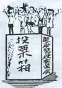
●不在者投票の期間及び手続き(別表2)