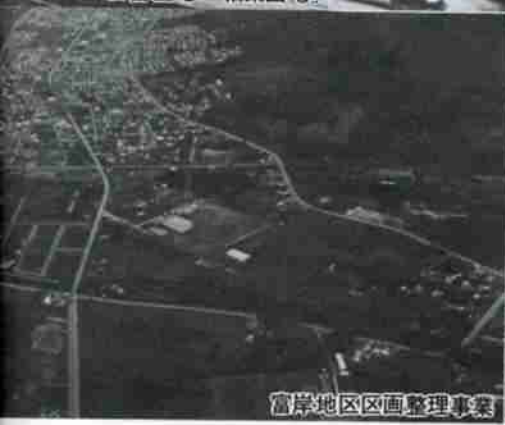
富岸地区区画整理事業