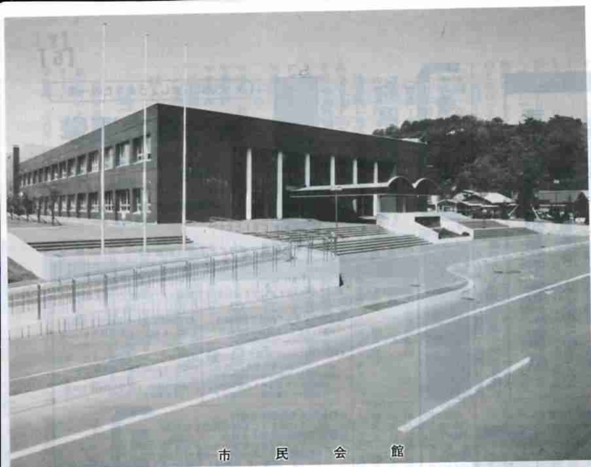
市 民 会 館