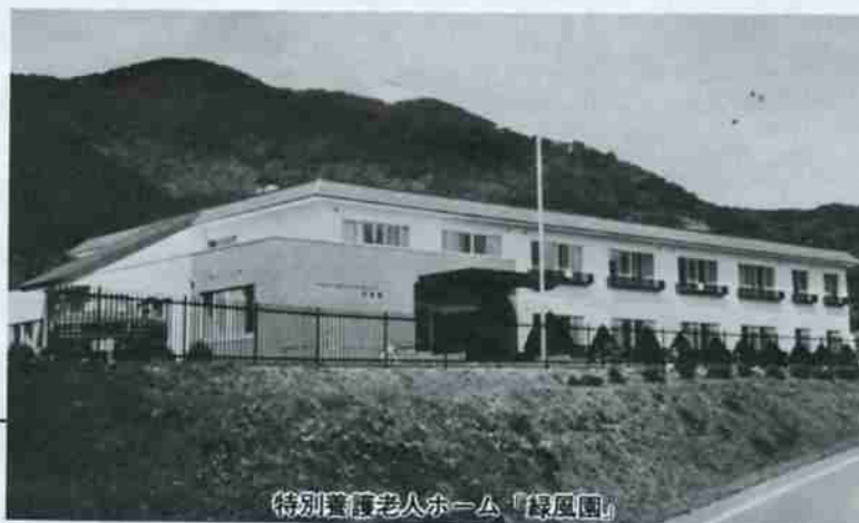
特別養護老人ホーム「緑風園」