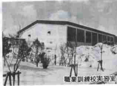
職業訓練校実習室