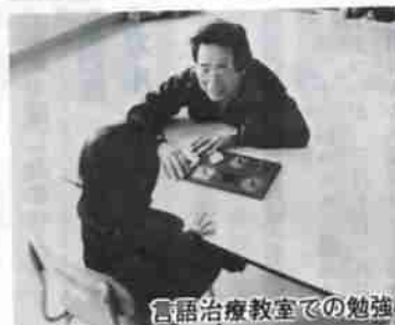
言語治療教室での勉強

また、新しい技術革新に対応するため登別地方職業訓練校に電子計算機科と編み物料を新設し、実習室も新設するなど、訓練の内容とともに設備も一層充実されました。