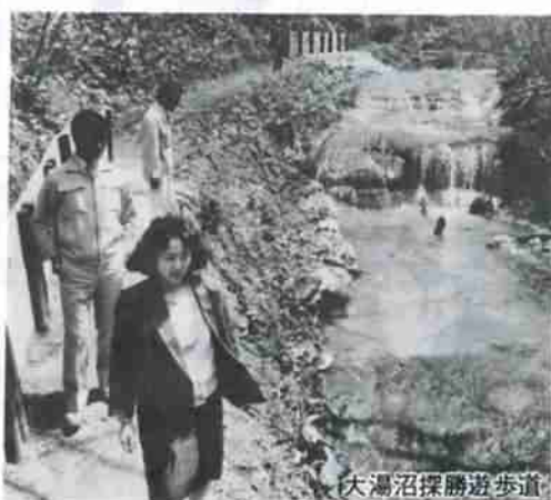
大湯沼探勝遊歩道