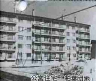
公営住宅「柏葉団地」