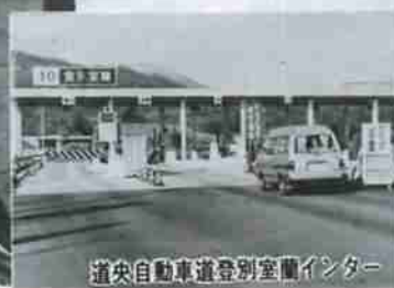
道央自動車道登別室蘭インター