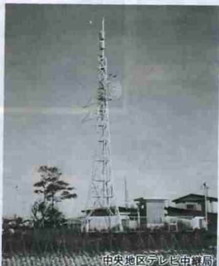
中央地区テレビ中継局

理想的な都市環境を目指す市では、長期的な視野に立った快適で住み良い生活環境作りを積極的に進めています。公共下水道は、文化都市必須の要件であり、65年の一部供用開始を目指して、幹線管路の埋設工事が進んでいます。公営住宅も年次計画で建設が進められています。良好な環境の住宅街を目指して富岸地区土地区画整理事業も進められています。また、長年の懸案だった中央地区のテレビ難視聴も解消しました。要望の多い市道舗装排水事業には4年間で約20億円をかけ整備を進めてきました。