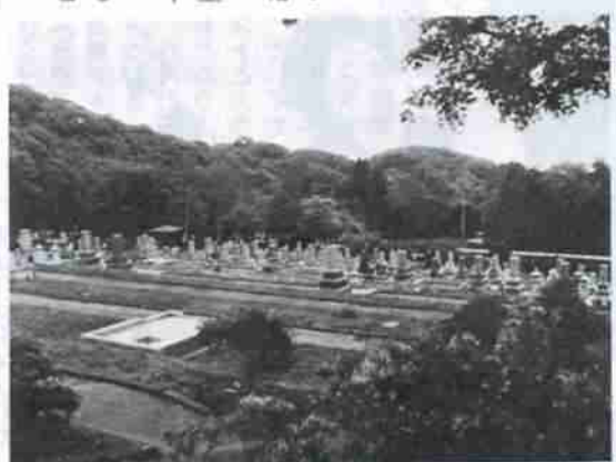
美しい自然に囲まれた亀田霊園

● 問合せ先 保健衛生課（Ⅱ⑤） 2111内線248・249 ※受付当日は貸付料金の必要はありません。 また、電話での受付は致しませんのでご注意ください。 なお、亀田霊園の案内書は本庁保健衛生課、各支所に用意してありますのでご利用ください。