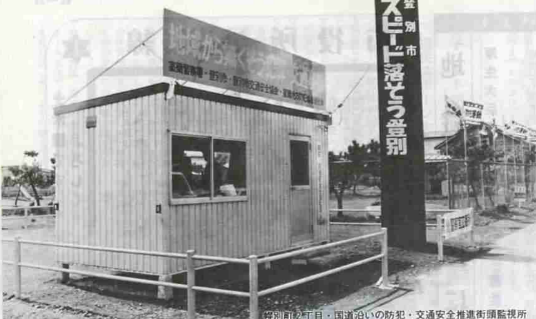
登別市 登別町2丁目・国道沿いの防犯・交通安全推進街頭監視所