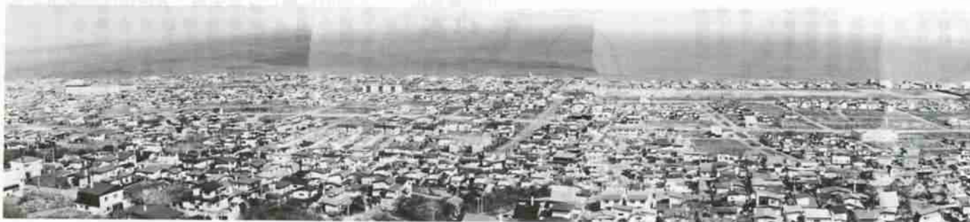
区画整理事業によって環境良好な住宅街となった若草・新生地域