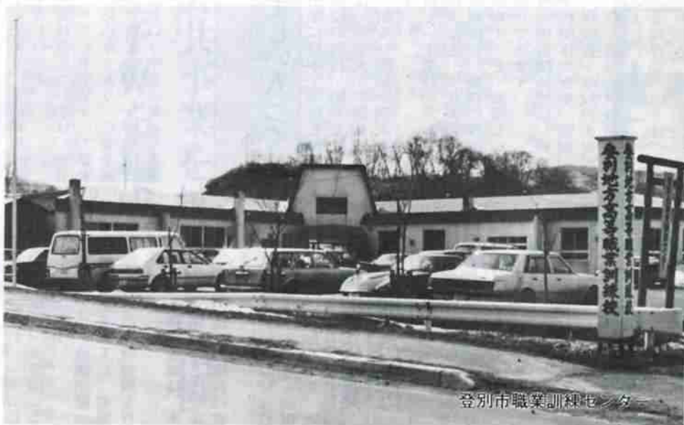
登別市職業訓練センター

このほか61年度では、若草町4丁目ののびのび公園が2,911万円の事業費で新設されるほか、新川町3丁目の新川公園も525万円で設計委託に入ります。