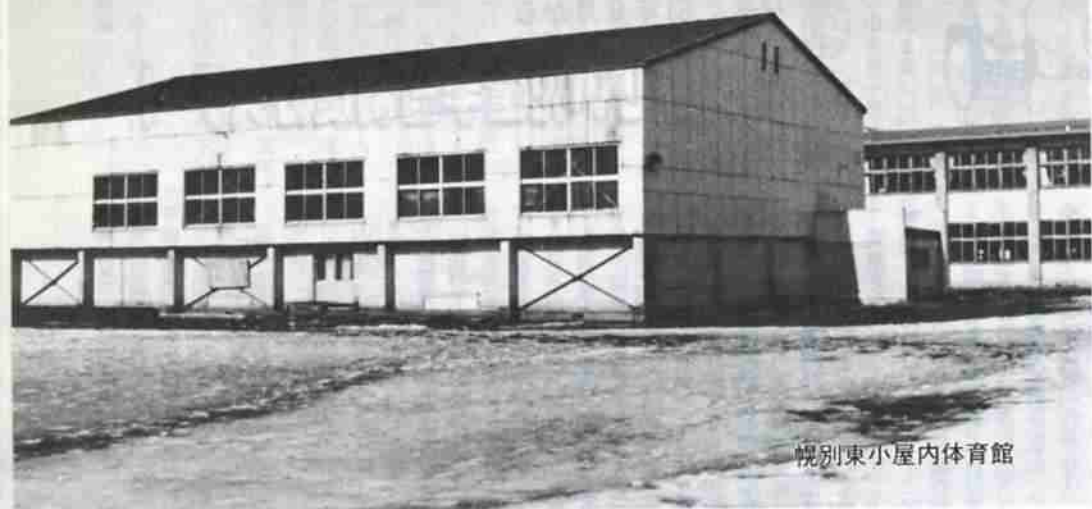
幌別東小屋内体育館