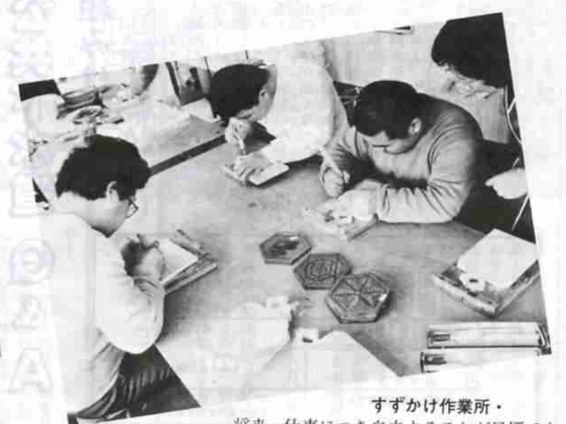
すずかけ作業所・将来、仕事につき自立することが目標です。