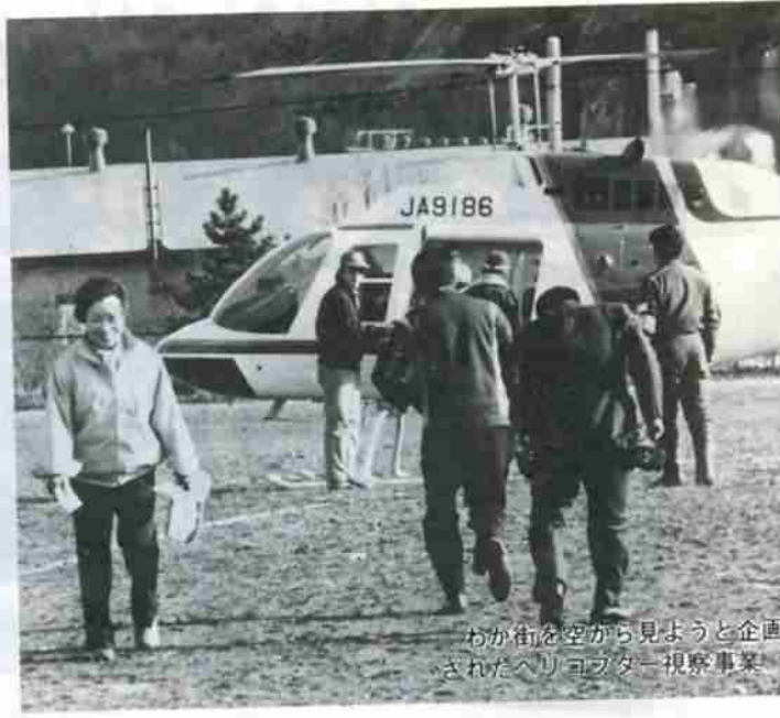
わか街を空から見ようと企画されたヘリコプター視察事業