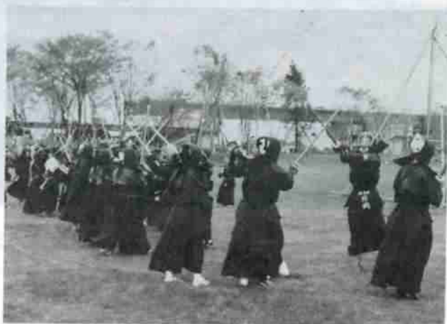
開園式でのアトラクション、空手、剣道などの野試合、ゲートボール大会などが行なわれました。

この作業所は、市の旧職員住宅を改造したもので、訓練室、更衣室、トイレ、どが整備され、木工作業台、ミシンなどの訓練用具が設置されています。 現在、学齢を超えた精神薄弱者は市内に百八人。このうち在宅者は四十五人で「すずかけ作業所」に通所しているのは四人です。 作業所での訓練は、朝九時から夕方五時まで。午前中は基本的な生活慣習の学習などで午後からは、作業所前庭での畑作りや皮細工、ペーパーフラワーの作成に汗を流しています。 これら作業の指導にあたるのは「登別市手をつな