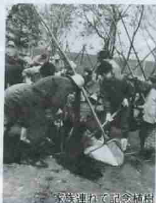
家族連れて記念植樹

を一般開放するため、去る五月二十六日に市民約千人の参加のもと川上公園開園式が盛大に開催されました。 テープカットやクス玉カットのあと、参加者全員による植樹祭も行なわれ、桜、ツツジ三百本が植栽されました。また、セレモニーとしてゲートボール大会や空手などの野試合が行なわれるなど、参加した市民は楽しい一日を過