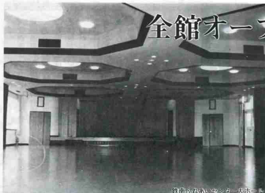
鉄南ふれあいセンター 大ホール

鉄南地区の文化活動、コミュニティ活動の拠点として、幌別町三丁目に建設を進めていた「鉄南ふれあいセンター」は、この四月に完成、一部使用を開始しています。 同センターは、鉄筋コンクリート三階建て、延べ千二百四十五平方メートルで、一階には肢体不自由児通園施設「のぞみ園」が入っています。広くて明るい訓練室と保育室は、床暖房で暖か。また、大小二つの浴槽をもつ広々とした温泉訓練室もあり、通園している十人の子供たちはのびのびと訓練を受けています。