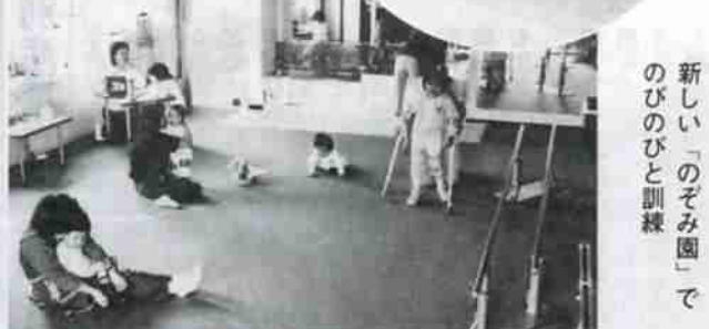
新しい「のぞみ園」でのびのびと訓練

はもとより、文化芸能の発表、グループサークル活動など広範な社会教育活動が展開され、地域文化の水準を向上することが期待されます。