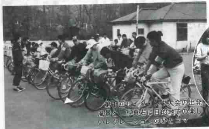
第十回サイクリング大会の出発風景と、写真右は目的地での楽しいレクリエーションのひとコマ

また、市では総合基本計画（昭和五十五年度から六十二年度）に基づき、それぞれの地区の特色を生かした個性豊かなマチづくりを推進しています。この期に、登別地区で芽をふいた自覚意識が他地区への刺激剤となり、市内全域での盛り上がりとなって、独自の活動へと広がることを期待したいものです。