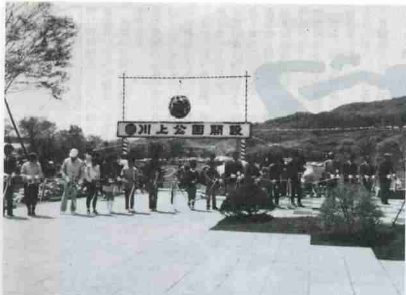
川上公園開園式テープカット

市では、幌別ダム下に自然とのふれあいを通じて余暇を健全に楽しむための身近かな施設として、緑と清流を活用し、周辺の自然景観との調和を図りながら、川上総合公園の整備を進めています。 同公園の全体計画は、総工事費十二億円で総面積九・四ヘクタールに多目的広場、入