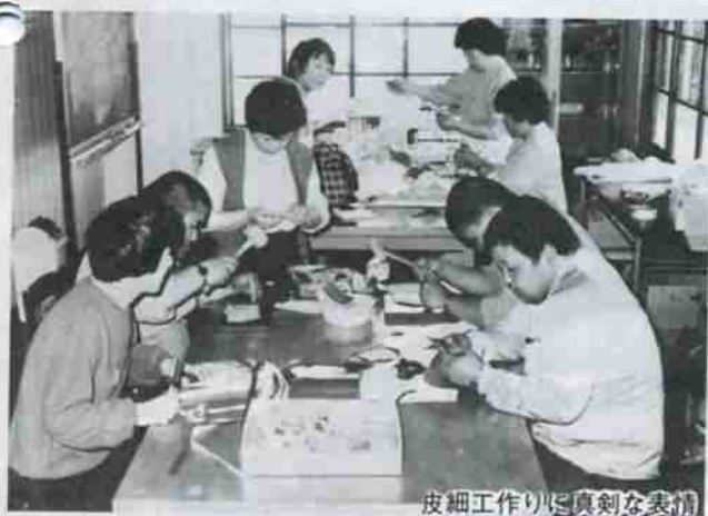
皮細工作りに真剣な表情