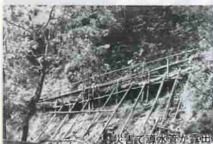
災害で導水管が露出

常に珍しく各市町村からの見学者も多数訪れています。 登別市の上水道は、昭和五十五年と五十六年度の二カ年で実施した「上水道第二期