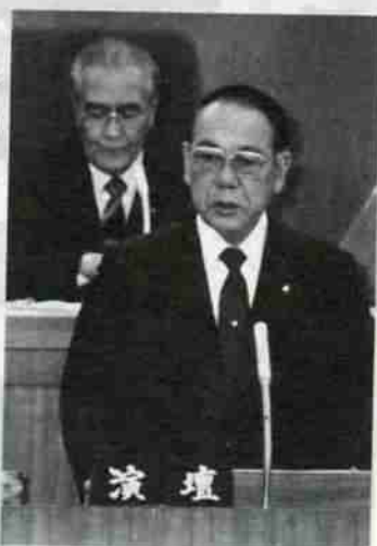
中浜市長が市政執行方針を公表する中浜市長(昭和60年第1回定例市議会本会議で)

三月四日から開会された、昭和六十年第一回定例市議会で、中浜市長は昭和六十年度の市政運営の基本方針と施策の概要を発表しました。市政執行方針の概要は次のとおりです。