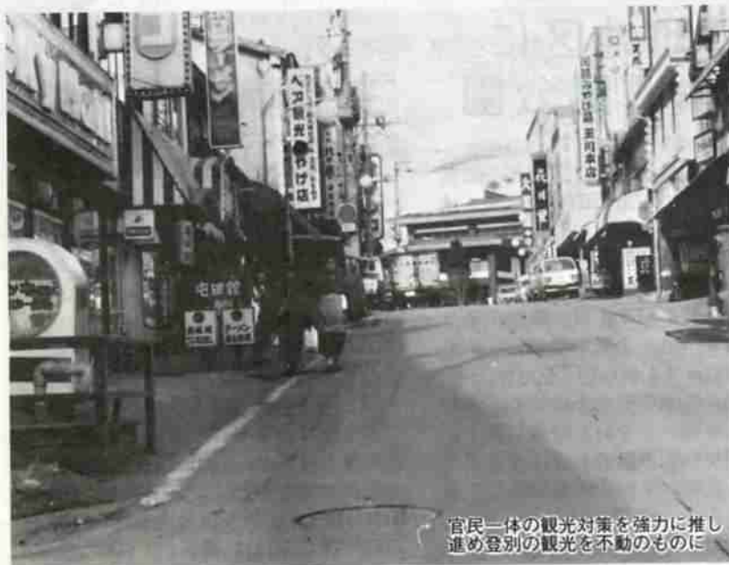
官民一体の観光対策を強力に推し進め登別の観光を不動のものに