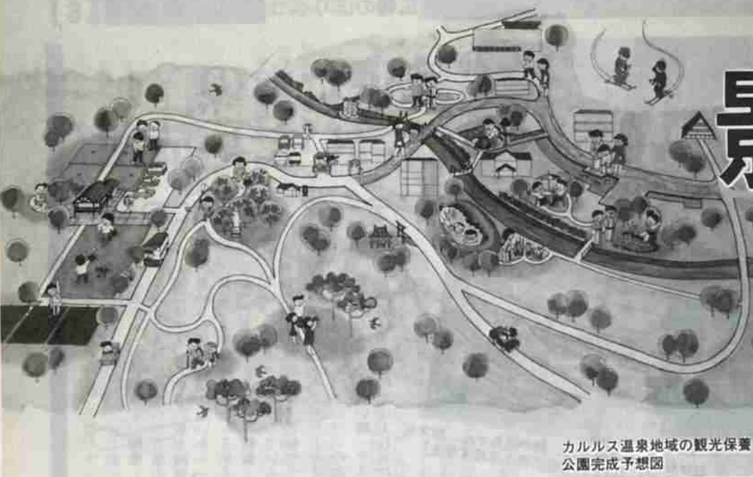
カルルス温泉地域の観光保養公園完成予想図

3月 昭和60年 今年度 市税など 況の中 (仮称) 盛り込み た予算 この 円を した。 す。