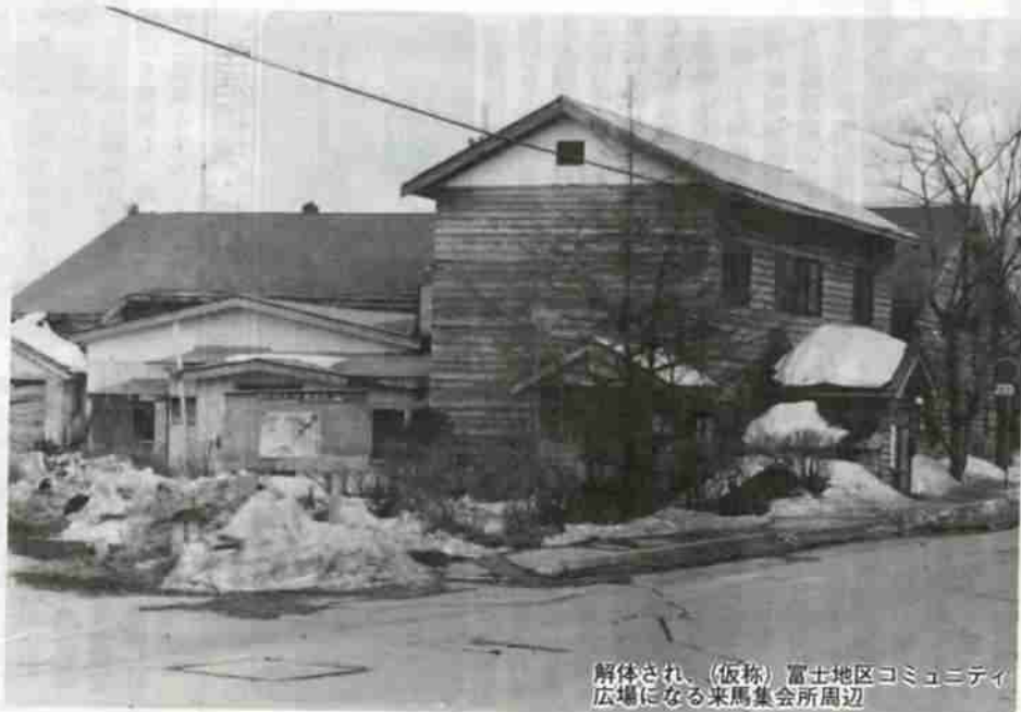
解体され、(仮称)富士地区コミュニティ広場になる米馬集会所周辺

本年度は、さらに整備充実を図るため、昨年度より5,000万円増額し、6億5,000万円の事業費を計上。市道42件、延長約7.8kmの改良舗装を実施するほか、市街地の幹線排水路11件、延長約3.6kmの整備を行います。