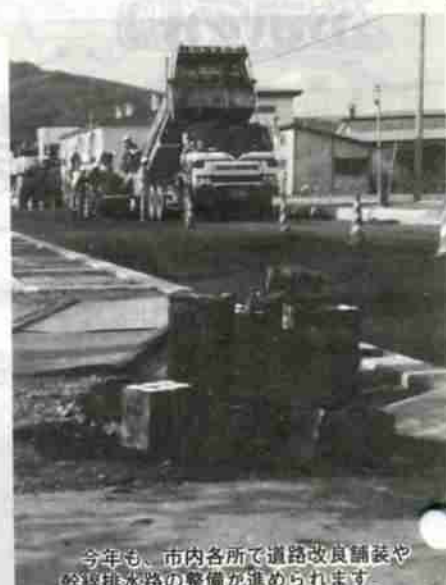
今年も、市内各所で道路改良舗装や幹線排水路の整備が進められます。

最初に、旧小学校跡地周辺の整備を今年度と来年度の2ヵ年で、38,000㎡の用地にスポーツセンターや多目的広場、テ