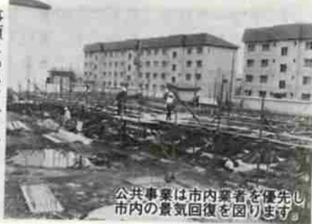
市内業者を優先し、市内の景気回復を図ります。公共事業は、市内業者を優先し、市内の景気回復を図ります。

以下、施策の概要は次のとおりです。市民の皆さんの絶大なご協力、ご支援をお願いします。