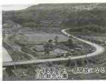
今年5月から一部開放になる川上総合公園