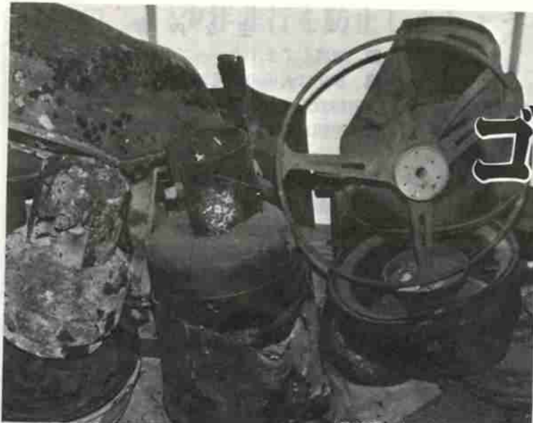
焼却炉の中から出てきた燃やせないゴミの山