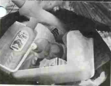
燃やせるゴミの収集日に出されたゴミ袋のなかは……

食べ物くず、紙くず、タバコの吸い殻、台所のゴミ(水をよく切ってください)、木くずなど。