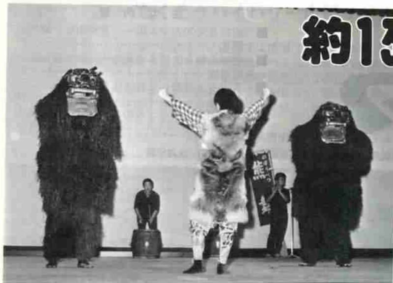
昨年の郷土芸能フェスティバルより