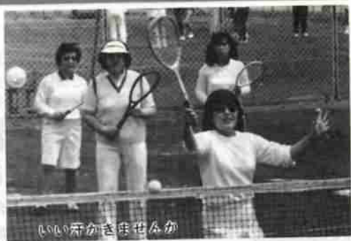
いい活かきせふか