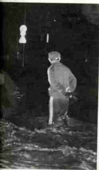
と化した市役所前の民家や商店に大きな被

市では災害対策本部を閉鎖しましたが、災害についての相談を次のおり受けていますので、お困りの方はお気軽におこしください。 ●生活物資、援護資金関係は民生部社会課へ。 ●住宅の相談は建設部建築課へ。 ●その他災害の全般的事務は総務部公聴広報課へ。