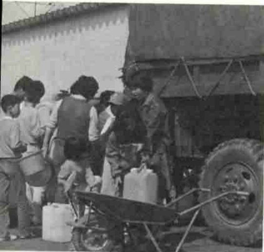
飲料水の給水を受ける皆さん。陸上自衛隊の全面的な協力をいただき、市から深夜まで、市内のすみずみまで走り