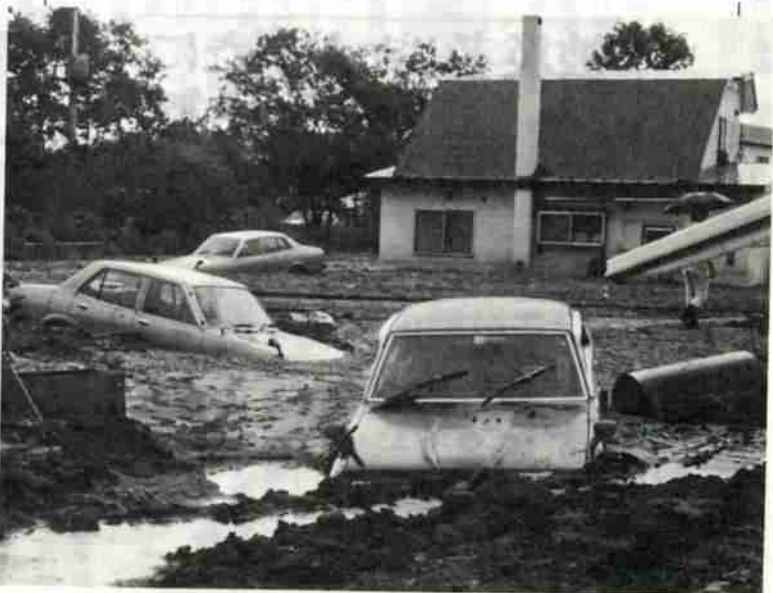
約500メートルにわたって路面が深くえぐられた道々洞爺湖登別線（汐見坂付近）。ここから流れ出た土砂が民家を流出させ、一帯を埋めつくしました。

着、冷静な行動のためのものであり、登別市民の防災に対する意識の高さが実証されました。被災地では、二十五日の夕方から、いち早く土砂の除去などにとりかかり、市をはじめ各関係機関も復旧作業に全力を挙げていますが、家を全壊した方や生活必需品を流出した方々にとっては、しばらく不自由な生活を余儀なくされることとなります。