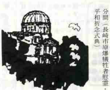
分間(長崎市原爆犠牲者慰霊・平和祈念式典)

八月六日・広島市、八月九日・長崎市の原爆の日を迎えるにあたり原爆死没者のめい福と世界恒久平和の確立を祈念して1分間のサイレンを吹鳴します。 原爆投下・終戦記念日には、みなさんもサイレンと同時に敬けんなささん。