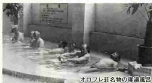
オロフレ荘名物の寝湯風呂

米馬岳登山のあとなどに疲れをカルルス温泉でいやすませんか。国民保養温泉や北海道老人クラブ連合会にも指定されているカルルス温泉は、神経痛や胃腸病、神経諸病などに効果があります。