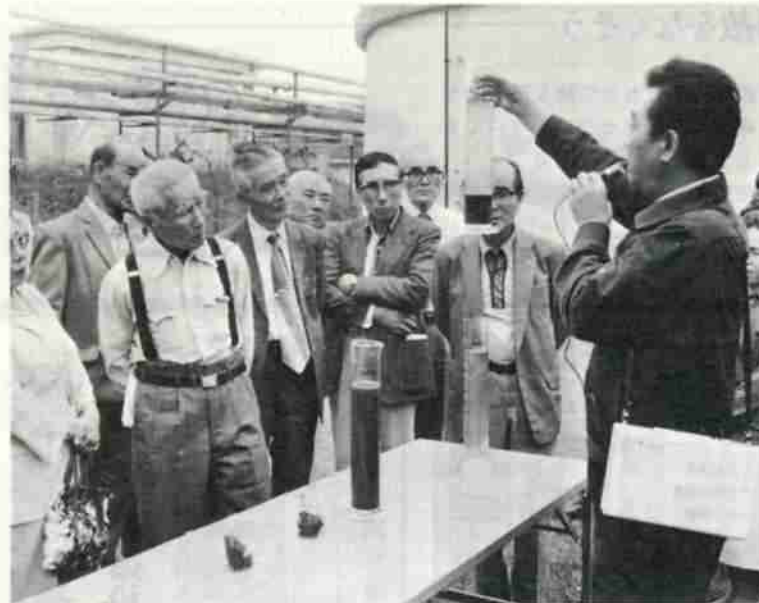
昨年の市民見学会から

市民見学会は、皆さんが納めた税金などが、豊かで住み良い街づくりにどう役立っているかを、実際に一瞥したいため昨年開催していません。 昨年は町内会単位で見学会を行ない、大勢の皆さんに参加していただいた大変好評をいただきました。 今年も次の要領で六回にわたって実施します。お好きなコース、都合の良い集合場所を選んでどしどしご参加ください。