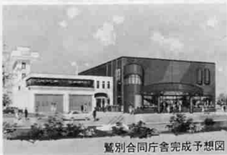
驚別合同庁舎完成予想図

ため、小中学校の営繕事業、特に今年度は、驚別小学校の校舎改修とグラウンド砂塵防止事業、西陵中グラウンド排水整備等を行ない、幌別西小学校の屋内体育館の改築をします。さらに、幌別小学校の校舎内に言語治療教室を設置し、こ