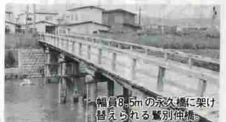
幅員8.5mの永久橋に架け替えられる鷺別伸橋。

うぐいす団地内と富士町6丁目に消火栓を新設するほか、中央支署のサイレンを更新します。