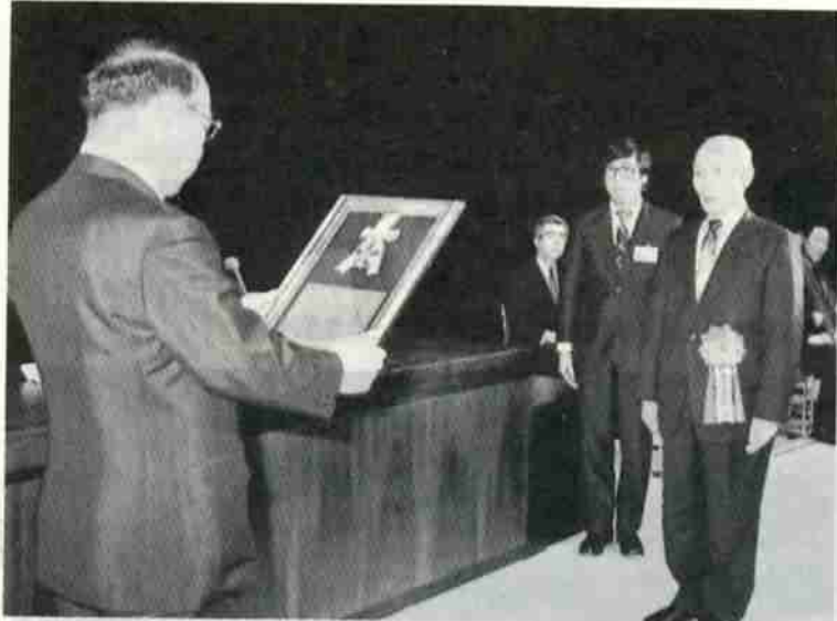
市民会館落成記念式典の席上、中浜市長から名誉市民章が贈られました。

名誉市民の制度は、市勢の発展 十二年に制定されました。または社会文化の興隆に著しい功績があったかたに、名誉市民の称号を贈り、その功績と栄誉を永くたたえることを目的として昭和五