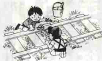
鉄道の妨害事故を防ぎましょう

● ドライバーは、踏切での一たん停止、左右確認を必ず行いましょう。 ● 踏切でエンスト、故障が起きたら踏切事故報知機、発炎筒を使用してください。