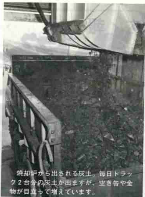
焼却炉から出される灰土。毎日トラック2台分の灰土が出ますが、空き缶や金物が目立って増えています。