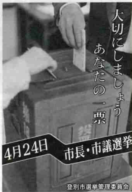
登別市選挙管理委員会

●麻しん（はしか） ▽対象児 生後12ヵ月から42ヵ月未満の幼児。 ▽接種の方法 1回接種。 ※満1歳になりしだい、各家庭へ麻しんの受診券を送付していますので、各自、病院または医院で接種を受けてください。 受診券が届かない場合は、保健衛生課（☎⑤2111内線249）へご連絡ください。 ▽接種上の注意