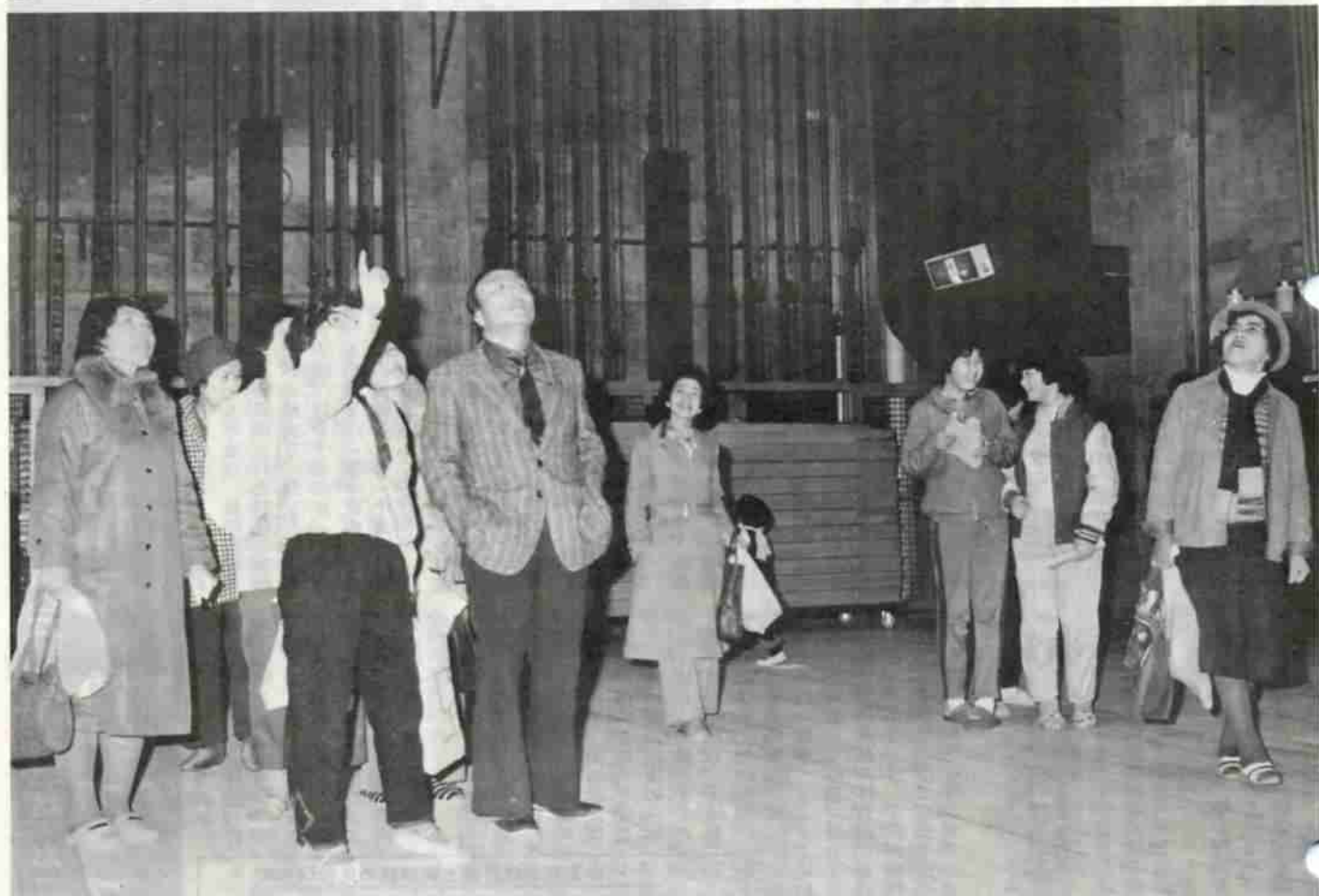
大ホールの舞台裏を見学する参加者。

●No. 368 ●昭和58年4月1日発行 ●発行/北海道登別市 ●編集/総務部企画広報課 ●印刷/北海印刷