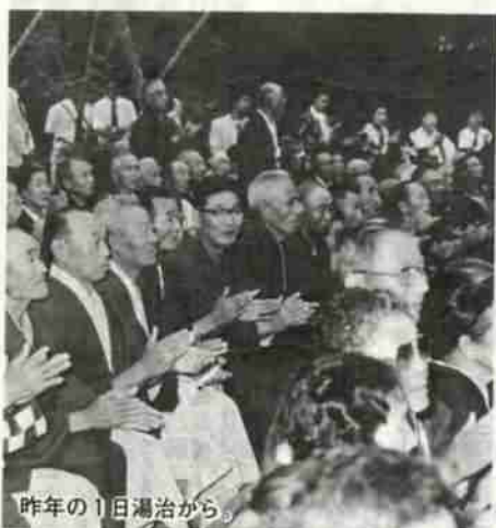
昨年の1日湯治から。

お問い合わせは➡障害福祉年金…市民課(市役所1階・TEL52111内線245)へ。福祉施設入所者(児)面会旅費助成事業