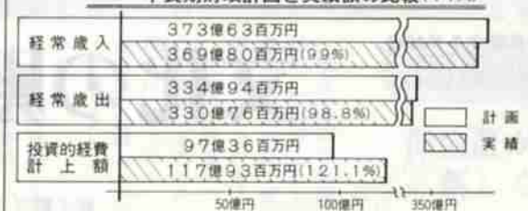
表(2) 昭和58年度 登別市各会計予算総括表