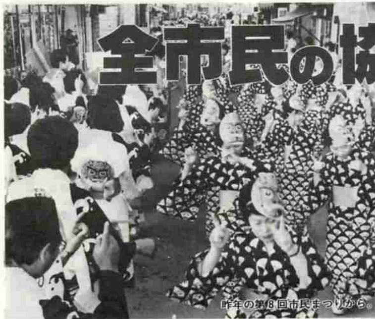
昨年の第8回市民まつりから