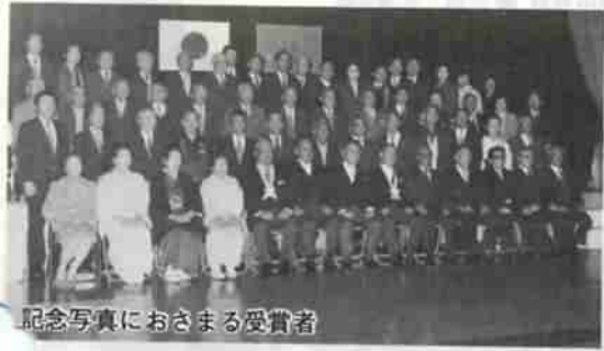
記念写真におさまる受賞者