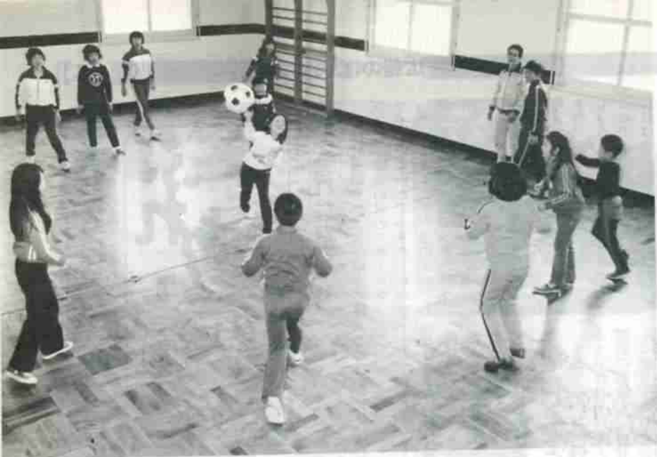
卓球、バドミントン、ドッチボールと、広々とした遊戯室は、子どもたちの体力づくりに役立てられています。