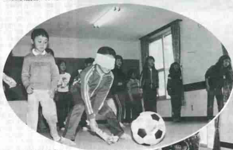
スイカ割りゲームを楽しむ児童。集会室は約36畳の広さで、じゅうたんが敷きつめられています。

美園児童センターの一日 みんな元気で遊んでいます 1月22日、市内で8番目の児童福祉施設としてオープンした美園児童センターは、これまでの児童館よりひと回り広く、スポーツ指導員が配置されています。今年度は、遊びながら体力づくりができる「ナインピース障害セット」や体力測定器具が配置され、ミニ体育施設としての機能が一層充実されます。子どもの校外活動の場として、児童館や児童センターをご利用ください。