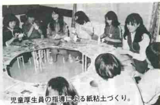
児童厚生員の指導による紙粘土づくり。