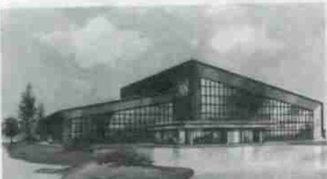
体育館完成予想図

一階には武道場やクラブ室などが設けられ、競技場は千四百四十平方メートルあり、バスケット、バレーがそれぞれ二面とれる広さで、市の総合体育館の約一・五倍もある大規模な体育館となっています。 同校では、この体育館を学生のクラブ活動のほか、各種スポーツ大会に大いに開放していくという意向です。 一方、実験棟の増築は、タイプ実習室、建築、土木実験室、電気工学実習室など六教室分、延べ千