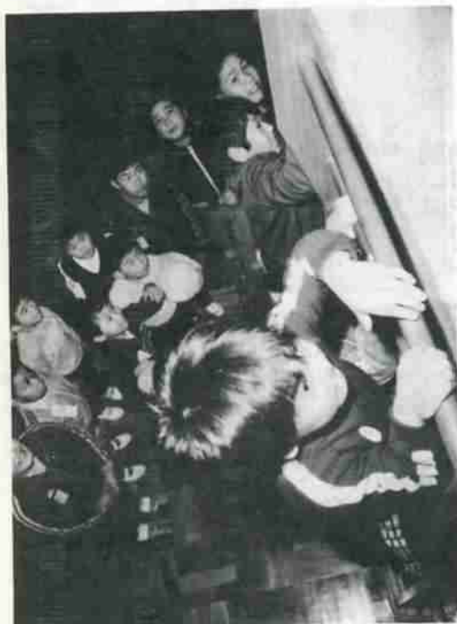
遊び仲間がいっぱいの美園児童センター。思いきり体を動かして、健康な体をつくってほしいものです。

美園児童センターの一日 みんな元気で遊んでいます 1月22日、市内で8番目の児童福祉施設としてオープンした美園児童センターは、これまでの児童館よりひと回り広く、スポーツ指導員が配置されています。今年度は、遊びながら体力づくりができる「ナインピース障害セット」や体力測定器具が配置され、ミニ体育施設としての機能が一層充実されます。子どもの校外活動の場として、児童館や児童センターをご利用ください。