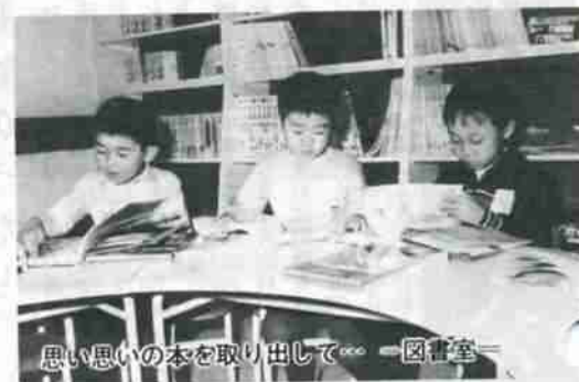
思い思いの本を取り出して... 図書室