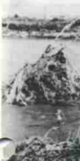
昭和38年の大水害の跡「小平岸橋」。

このように、河川跡の埋め立て地の多い新川町ですが、開拓の歴史は比較的早く、新川町一・二丁目や四丁目は、明治期から畑作地として開拓されてきました。