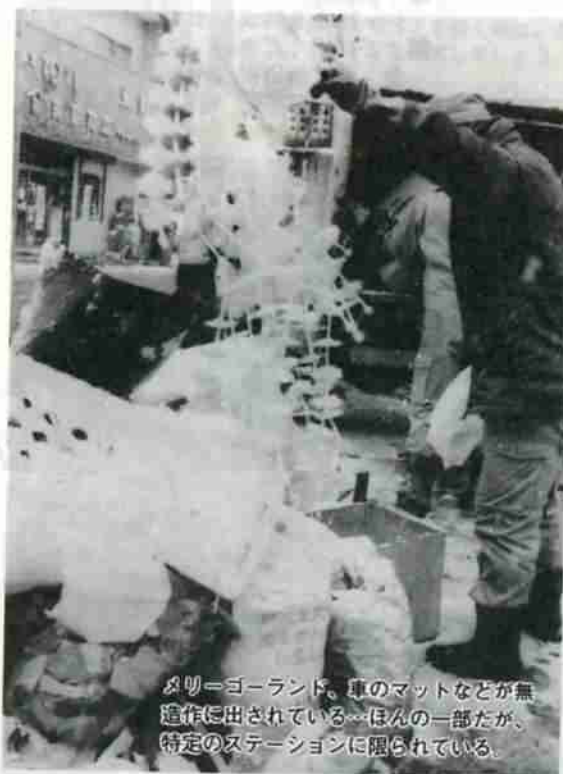
※切＝ヨーロッパ。車のマットなどが無造作に出されている。ほんの一部だが、特定のステーションに限られている。

ポリ容器、ビニール、食品パック、プラスチック製品、ゴム、皮、空カン、ビン、ガラス、金物、セトモノ、燃えがらなど。