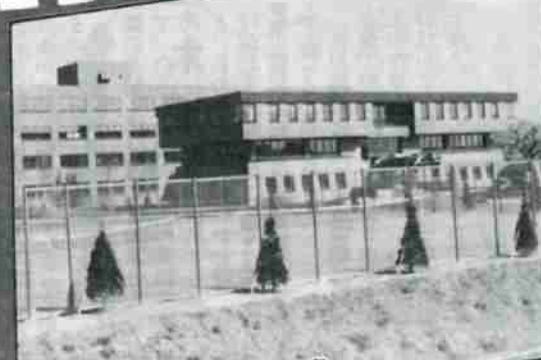
S56・10 完成した第1期工事