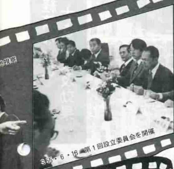
S55・6・18 第1回設立委員会を開催