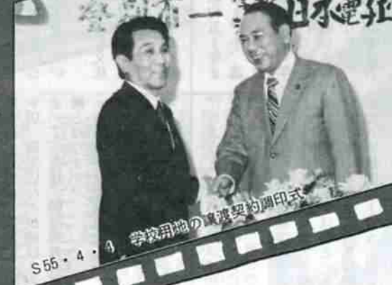
S55・4・4 学校用地の買渡契約調印式