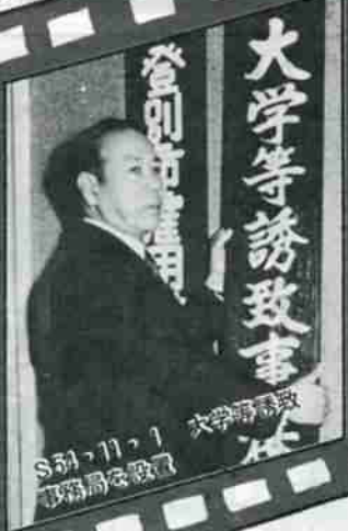
S57・11・1 登別市長 大学等誘致