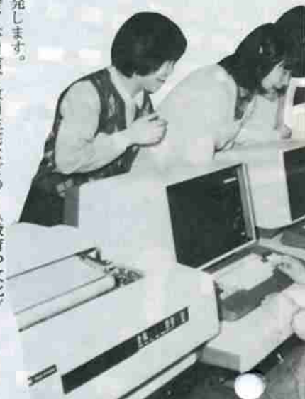
オフコンの説明を受ける女子高生。

学園都市構想の第一陣である同校は、時代の要請にこたえ、広い視野と幅広い知識をそなえた、高水準の技術者教育が可能であり、このことから、市民として、また道民としても大いに期待していきたいと思います。