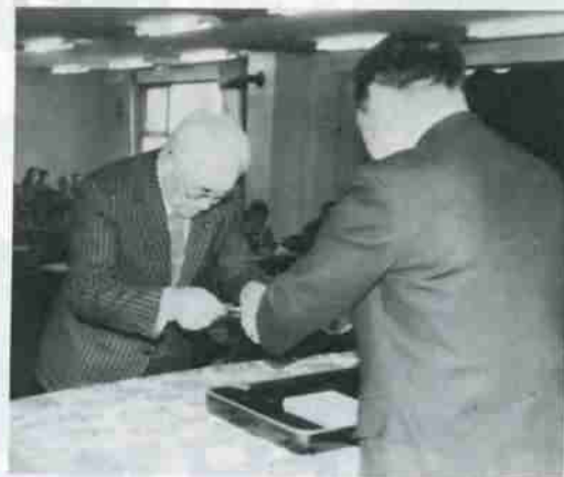
1月27日、労働福祉センターにおいて、委嘱状が手渡されました。

防災協力員として、町内会から百六人とアマチュア無線会員十四人が、一月二十七日、委嘱されました。 この制度は、災害の未然防止と地域住民の