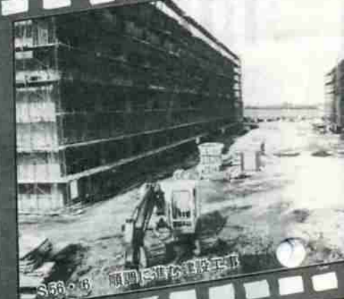
S56・6 願開校準備建設工事