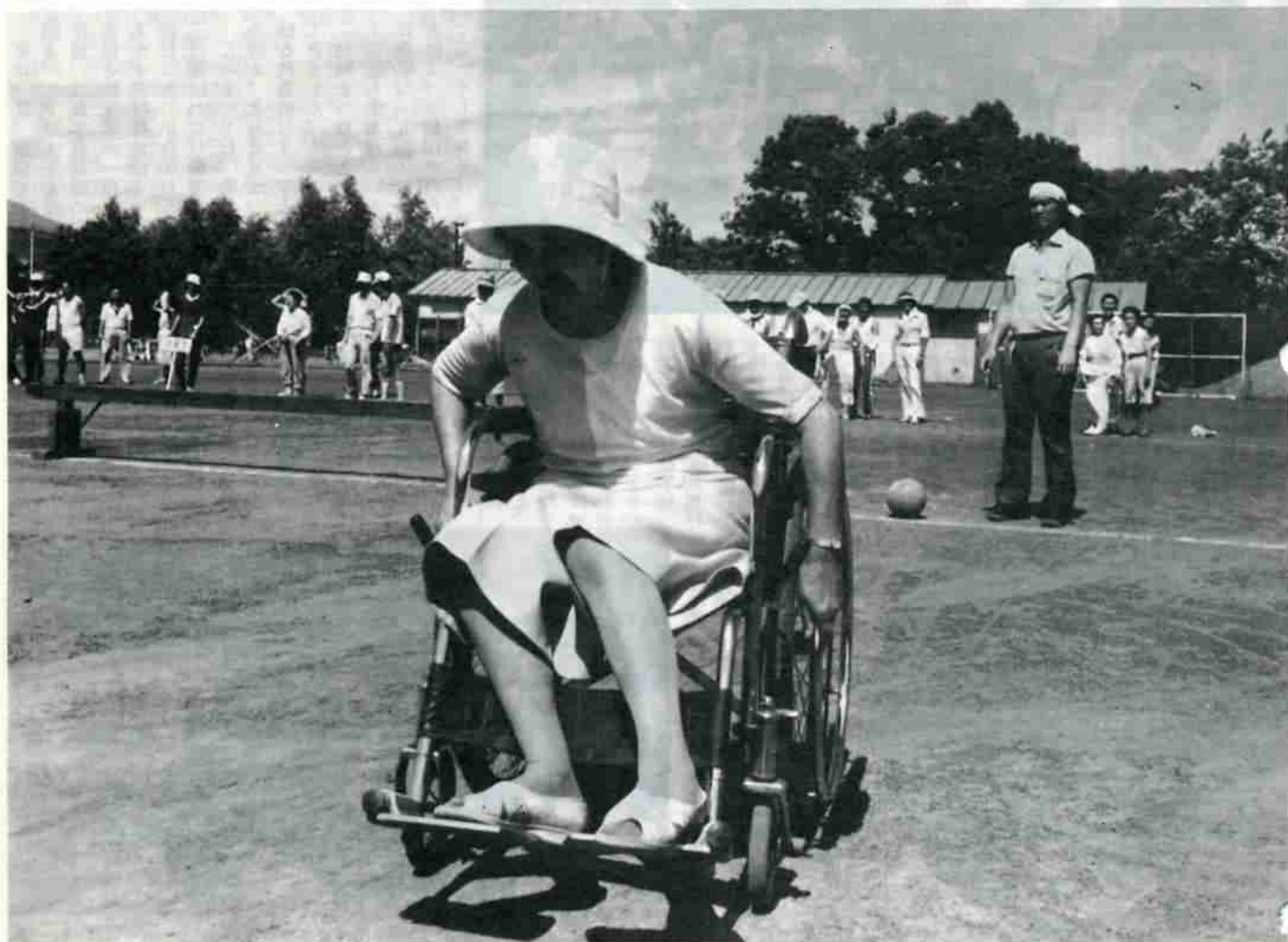
慣れない手つきでゴールを目指す参加者。家族も参加して行なわれたスポーツ交流会。＝障害競歩から＝