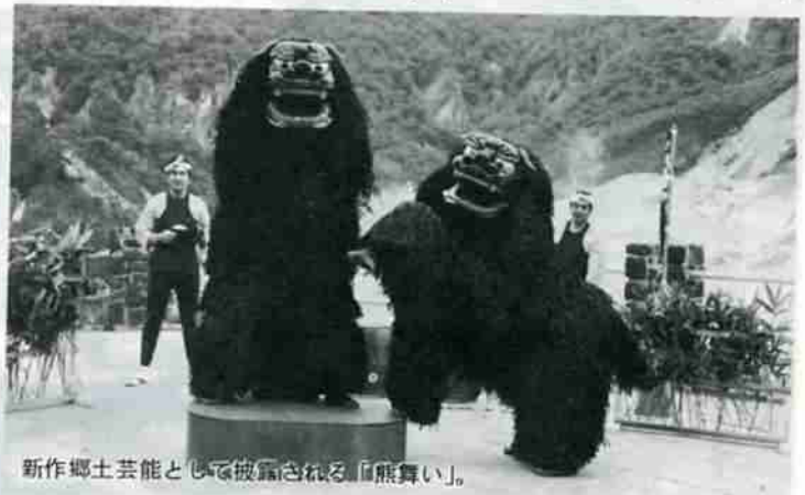
新作郷土芸能として披露される「熊舞い」。

また、期間中は次のとおり交通規制が行なわれますので、ご協力をお願いいたします。 なお、まつり期間中の駐車場として、地獄谷公共駐車場、温泉小ランド、温泉中ランドを準備していますが、今年も交通混雑、駐車場不足が予想されますので、マイカーの使用は極力避けてください。