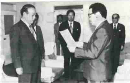
市内の交通事故死ゼロは、七月九日で三百日達成、八月五日現在ゼロ記録更新(三百二十七日)