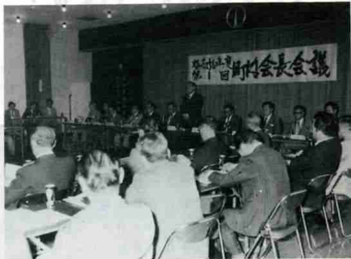
熱心な論議がされた町内会長会議

今年度第一回の町内会長会議が六月三十日午後二時から中央公民館二階ホールで開かれました。中派市長をはじめ部長以上が出席、住民代表の町内会長六十名が参加し、今年度の主な事業内容等について説明が行われ意見を交換しました。市長あいさつの後、関係助役から、昭和五十六年度の主な事業の主旨説明がありました。参加者からは「地熱開発の見通