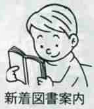
新着図書案内 市立図書館 5局4324

妊娠の全期を通じて、子供の歯はつくられています。ムシ菌にならない強い歯をつくるには、偏食