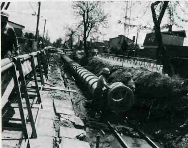
改修すすむ富士町の大排水

地域住民の永年の要望でありました富士町の大排水の改修が今年秋、完成をメドに工事が進められております。この大排水は、昭和十七年から十八年に日鉄室蘭製鉄所(現在の新日本製鉄室蘭製鉄所)が社宅建設を行なった時点で作られたものであり、約四十年経過しております。この改修工事は、昭和五十五年五十六年の二年間で、道と市が八千六百六十八の側こうを、丸管に変え埋めたての終った跡地には、張り芝をし、グリーンベルトにする計画です。市の工事は、兩年合わせて三百八十七万七千七百五十円でなっております。また道の工事は昨年が六十九万四千九百五十万円となっており、残りは今年発注し完成は、十月頃の予定です。この排水の改修工事が完成しますと、悪臭もなくなり、市街の美化も進められ、また子供達も危険な側こうがなくなり安心して、通学ができます。