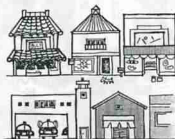
7月1日 事業所統計調査

日ごろ皆様のお世話になっている簡易保険の積立金は、学校建設道路整備、公園等の公共施設の充実のために利用され、地域住民の福祉向上に役立っています。今回、簡保資金でつくられた施設をテーマとした写真コンクールを次の要領で実施しますので、多数の作品を、お寄せください。 ●テーマ：簡保資金でつくられた施設を題材とする作品(学校・