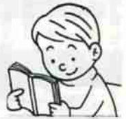
新着図書案内 市立図書館 5局 4324