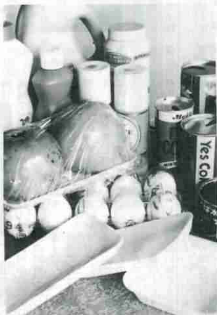
=写真上=清掃工場に持ち込まれるワースト3。①食品パック ②シャンプー・洗剤の容器 ③空かん