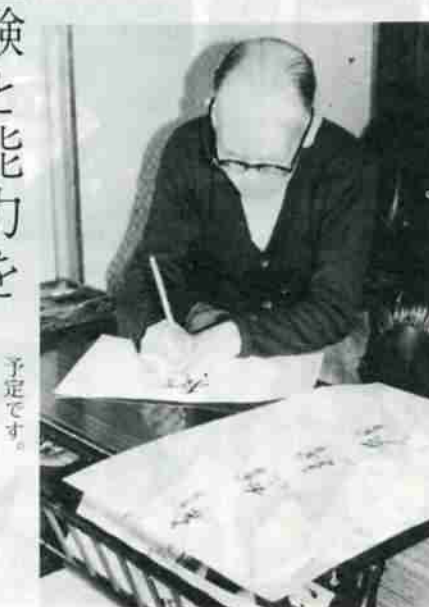
毛筆や植木の手入れなど……特技を生かし、積極的な人生を歩みませんか。

高齢のため就職は望んでいないが何か仕事をしたい、何らかの収入を得たい、という高齢者のために、市では、六月上旬発足に向けて「登別市高齢者事業団」（仮称）設立の準備を進めています。