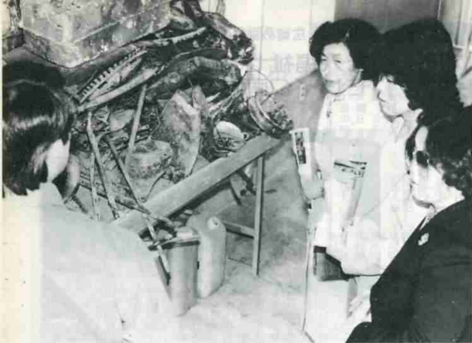
燃え残った鉄くずの山に、思わずため息が出る。この他、空かんは毎日1,000個にのぼるといふ