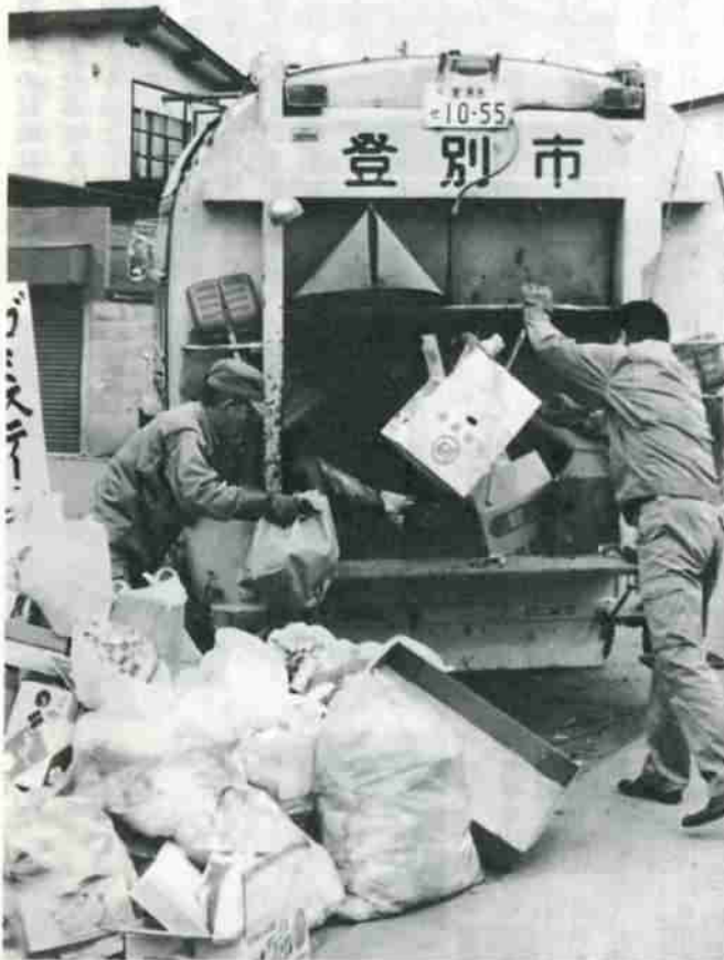
燃やせるゴミの収集日。この中に、再資源として活用できる物が入っていないのだろうか