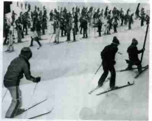
土曜・日曜日のリフト乗り場は長蛇の列

例年になく異状暖冬が続き、雪不足で悩まされていた道内の各スキー場も、今年に入りようやく本来の積雪となり、雪を持っていったスキーヤーを喜ばせています。 しかし、そこは雪の本場北海道関係者やスキーヤーの気持を察知