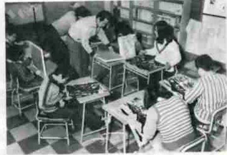
十人いっしょの図工の授業 学年に応じて作品の大きさが違う。

毎年北海道教育美術展に出品しており、この二年間は連続して入賞者を出しています。 体育の時間は、とても正規の人数での野球やバレーボールなどはできませんが、夏の間はテニス、冬期間は近くにあるカルルススキー場を利用するなど、環境をいかした体力づくりを注いでいます。 このほか、札内小中学校と合同で競技大会やスキー・スケート大会を行ない、子供達の交流を図るとともに、多人数での経験をふませ、辺地校の欠点を補っています。 また、運動会では父母や地域の人達、さらに旅館のお客さんまでも一緒にあって、楽しい一日を過ごしています。 学校行事や児童の詩、作文などを載せた、月一回発行の「学校だより」が、学校での生活を知らせ父母とのつながりを深めています。