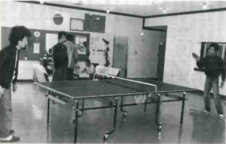
昼休み時間、中央ホールにある卓球台で遊ぶ訓練生。