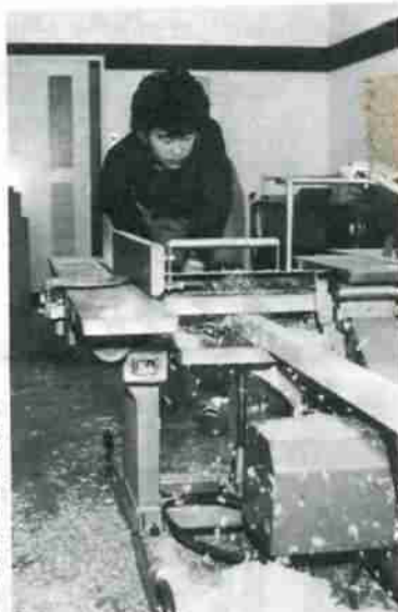
小型万能木工機、携帯用電気かん、電気角のみ機など機械操作の習得も欠かせない訓練の一つだ

生かしています。 《スポーツでも好成绩》 このような教育活動は、昔からの徒弟制度とは全く異なる、様々な効果を上げています。 たとえば、訓練校でのコミュニケーションは、連帯感を深め、職種の違いを友人との出合いは、将来への夢をふくらませます。