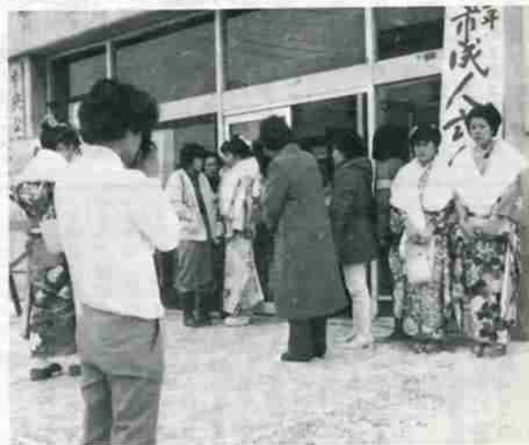
成人式の思い出に…