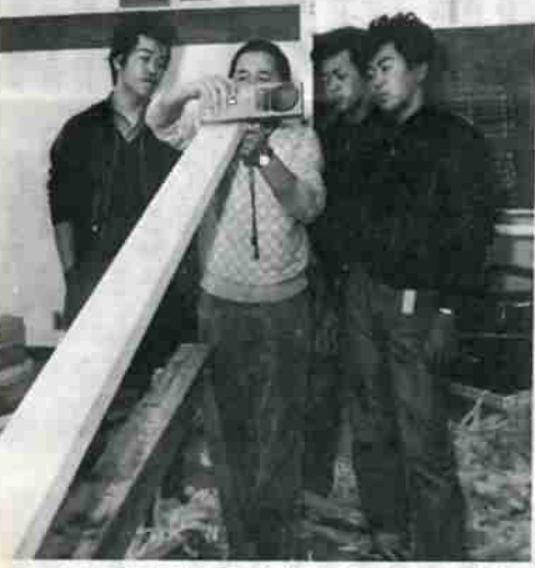
「こうして見れば、面の仕上がりわかる。」現場に出てもすぐに役立つ、生の指導が訓練校の特色だ。

練センターが設置されました。 登別地方高等職業訓練校には、建築科、左官科、板金科、建築製図科の五科目があり、働きながら専門技術を習得する技能者の養成を行なっています。 同校は、登別技能協会に所属する事業主が、道知事の認定を受けて事業所内の子弟を教育するために設立したため訓練生は、登別技能協会に所属する事業所で雇用されることが入校の条件となっています。 （八十割の出席率が必要） 修業年限は、建築科が三年（専修訓練校、高校卒は二年）で、他の科目は二年となっています。 授業時間は、四月から十二月までの期間は週一回六時間、比較的に暇になる一月から三月までの期間は、土・日曜日を除く一日六時間となっています。 ただし、建築製図科については夜間授業のため、年間を通し週十六時間（一日三時間、週四回）となっています。全体は八十割以上出席しなければ卒業で