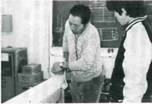
講師の実技指導に、真剣なまなざしの訓練生。