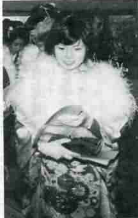
女性の晴着姿が目立ちました