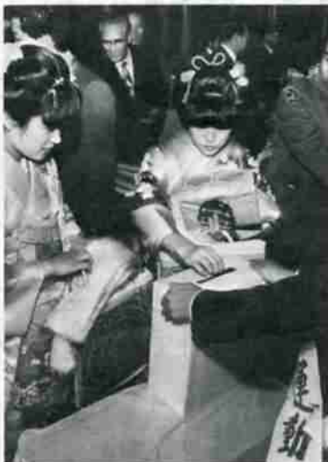
募金運動に協力する新成人