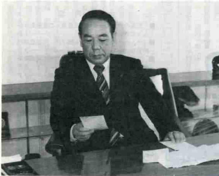
寄せられたはぎに目をとおす中浜市長

広く市民の声を聞いて、市政に反映させるとともに、市民との対話を深めるために、昨年十一月一日から十一月三十日までの間実施しました「私の声を市長に送る月間」の集約が終了しました。