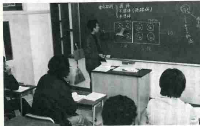
1クラス10人というミニ教室、ここでは電気工学概論の授業が行なわれていた。(板金科)

《建築士目指す女性コンビ》 訓練校という点、男性のイメージが強いのですが、建築製図科には二人の女性が二級建築士の資格習得を目指してがんばっています。 週四回、午後六時から九時までの夜間講習は、決して楽なものではありませんが、四月には二年目の修業課程を迎えるという二人に講師やクラスメイトも温かい声援を送っています。