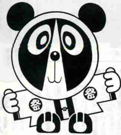
NOBORIBETSU CITY FESTIVAL