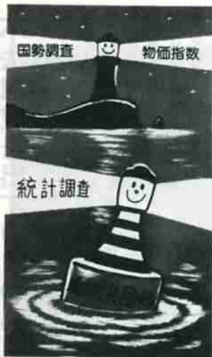
統計は暮らしの道しるべ

「統計は明るい暮らしの道しるべ」といわれます。ちょっと見ただけでは、単なる数字の羅列のように思えますが、この数字が、実はわたしたちの毎日の暮らしと密接な関係を持っているのです。 たとえば国勢調査の結果は、雇用をはじめ教育、交通対策、社会福祉対策、将来人口の推計など、わたしたちの生活に必要な施策の重要な基礎資料となっています。 また、毎月発表される「消費者物価指数」は、国民年金や厚生年金などの支給額の「増額」に関係がありますし、財産相続や補償問題にも利用されています。 では、わたしたちの主食であるお米の値段は、生産者米価の算定についてどのような統計が生かされていますか。