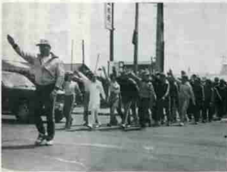
毎年行なわれる、街頭指導。(5月10日、青空交通安全教室のもよう。)

個人カルテには、学習内容を理解していく過程が記され、ひとりひとりに応じた最適な指導が行なわれています。