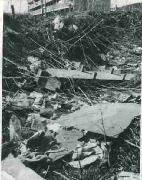
不法に捨てられたゴミは街の美観をそこね環境破壊につながっていく

六月五日から十一日まで、環境週間です。わたしたちの家庭から出るゴミの量は、年々、増える一方です。 いまや、「ゴミ戦争」といわれるほどで、膨大なゴミの量と処理費用の増大は、財政的にも深刻化する一方です。また、山や川などの自然も、ゴミ公害に泣いています。レジャーを楽しむ人や、近くに住む人たちのマナーの悪さが、貴重な自然を痛めつけ、まちを汚しているのです。よりよい環境をめざす私たちが何を考え、どう対処すればよいのかを、警別連合町内会、片倉町内会婦人部の例をあげ、これからのすみよい環境づくりについて、特集してみました。