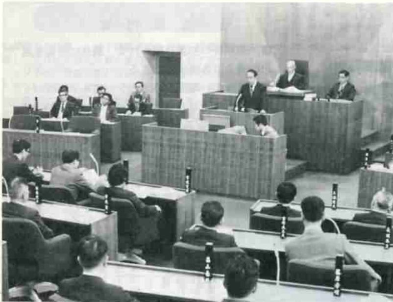
第二回臨時市議会のもよう

主な案件は、正・副議長の選挙をはじめ各常任委員会などの選任、専決処分についての報告、市税条例の一部改正、助役の選任など議案十四件が審議されました。今回の臨時市議会で決まった市議会の構成、および各会派のメンバーを次のとおり紹介します。