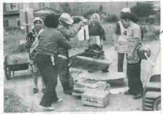
鷺別川の清掃に汗流す連合町内会員

が捨てられたり、汚水のたれ流しで、すっかりよごれてしまいました。このまま放置しておくと、ますますひどくなると思います。鷺別地区の全町内会が、昭和四十九年に対策委員会を設置して、二年間検討、協議をかさね、徹底したPR活動を続けて町民に浸透、五十一年から、鷺別川の清掃を続けています。一人一人以上の協力で、五百人から九百人の労力奉仕、重機等の無料提供、市、土現の強力なバックアップで、毎年実施してきました。おかげで、鷺別川からゴミがなくなり、市民憲章の趣旨徹底に役立ったと思います。今後は、公共下水道の早期着工を期待しています。