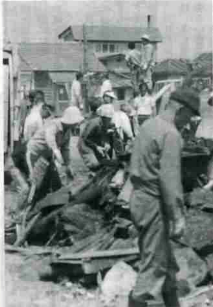
資源回収に町内会ぐるみで取り組む片倉町内会婦人部