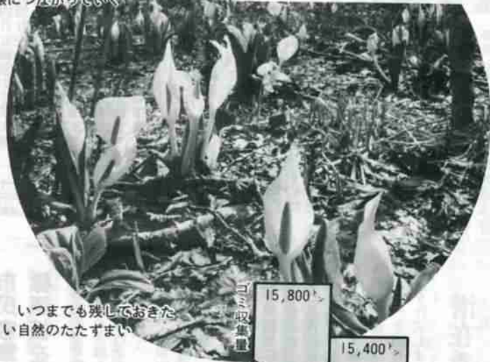
いつまでも残しておきたい自然のたすまじ