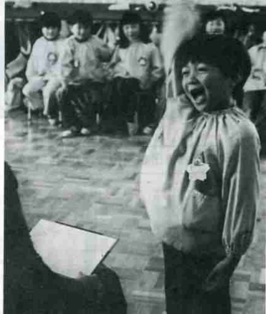
自分の名前は、大きな声ではっきりいえるよ。だって、ほくはもうすぐ小学1年生

ことし新一年生になる子供たちを持つ家庭では、もう一年生になるんだなあというほのぼのとした頼もしさと、規則正しい学校生活についていけるだろうか？ 通学途中の安全は？ 健康で学校生活を過ごせるだろうか？——といったさまざまな心配が、わが子を見る目に交錯しているのではないだろうか。 今年、市内で約千人の新一年生が誕生します。今号では、子供を明るく元気に通学させようと、入学前の心構えをみつめなおしてみました。