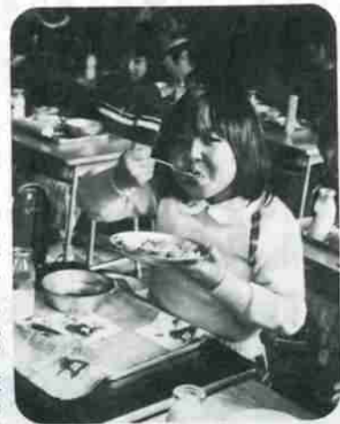
「きょうはカレーだよ」米飯給食も登場してメニューもグリーンと豊富