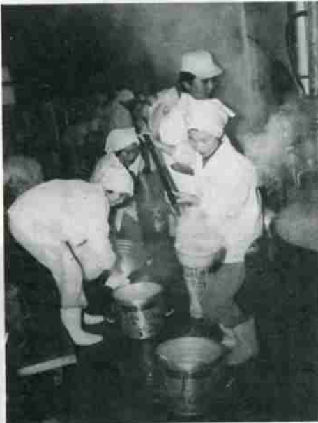
学校給食センターの調理室

という結果が出ました。全体として、中学生に好き嫌いが多く、特に中学女子にいちじく給食は栄養があつて、おいしく食べてもらえることが大切で、そ