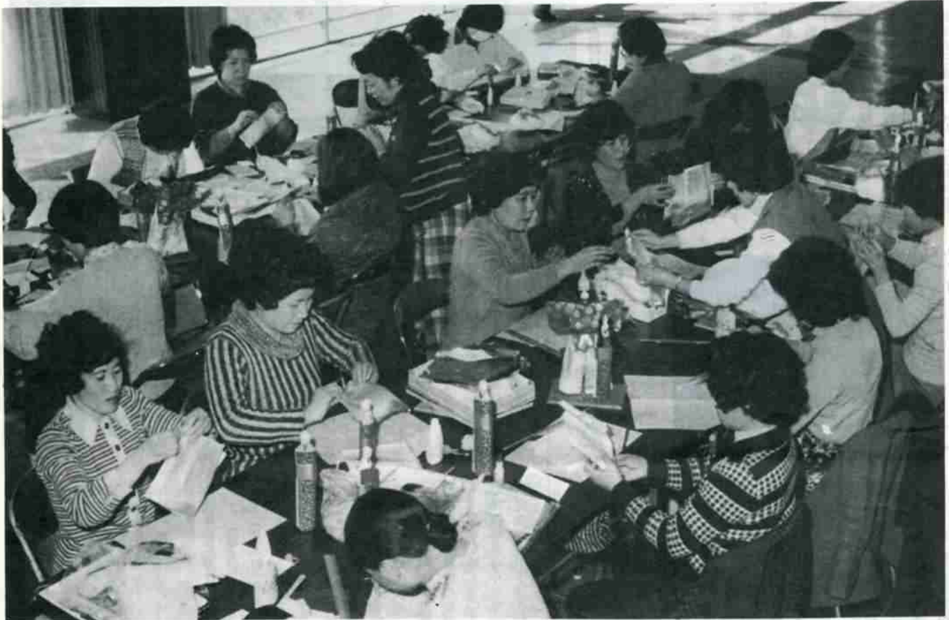
中央公民館2階ホールで開かれた和紙人形教室のもよう