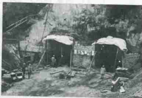
新設中の蘭法華トンネル

国鉄室蘭本線の電化工事が進められていますが、市内富浦町の現在使用中のトンネルは、断面が小さく電化に不向きなため、既存トンネルの北側に新しい蘭法華トンネルを造成中です。延長三百二十分のうち、すでに五十分以上すすみ本年秋完成をめざしています。