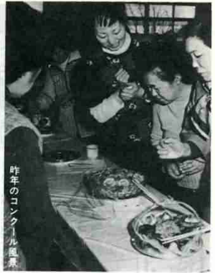
昨年のコンクール出品