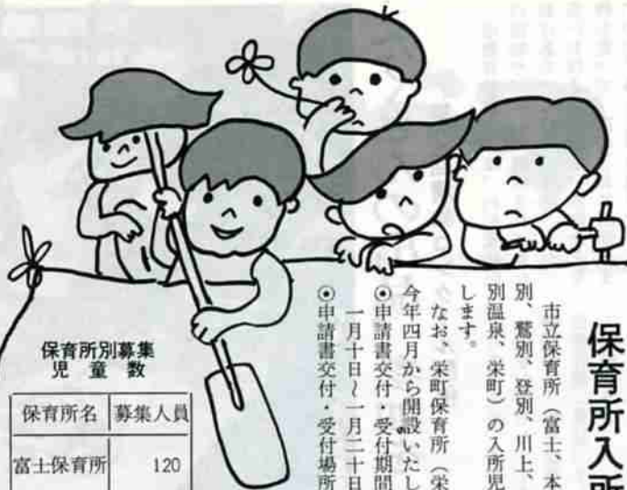
保育所別募集 児童数