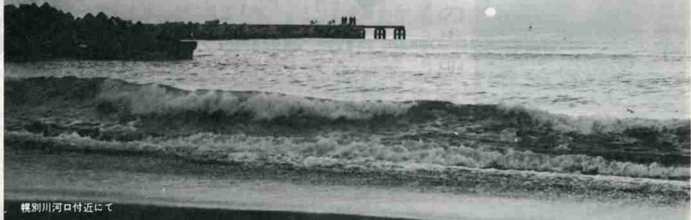
横別川河口付近にて