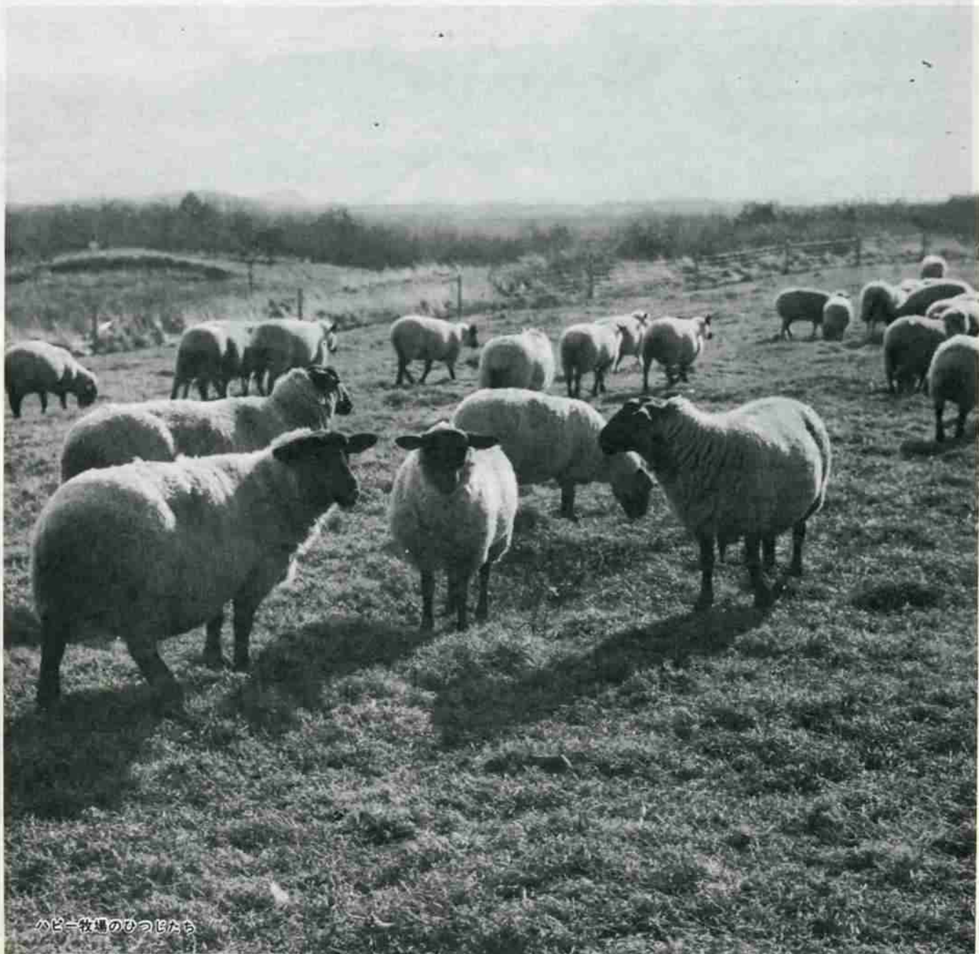
ハッピー牧場のひつじたち

ご覧ください 1月1日朝8時HBCテレビ全国向け生放送、 市内札内町のハッピー牧場と湯鬼神神楽が紹介されます。