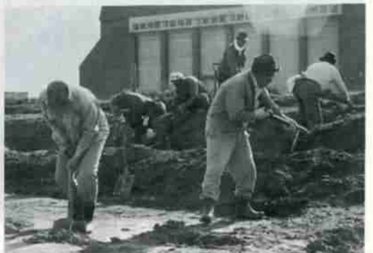
現在は、総合体育館周辺の整備にも従事しています

日の労働日のうち六日出て働けば失対を続けていくことができたので、どれだけ助かったか知れませんが、と言います。