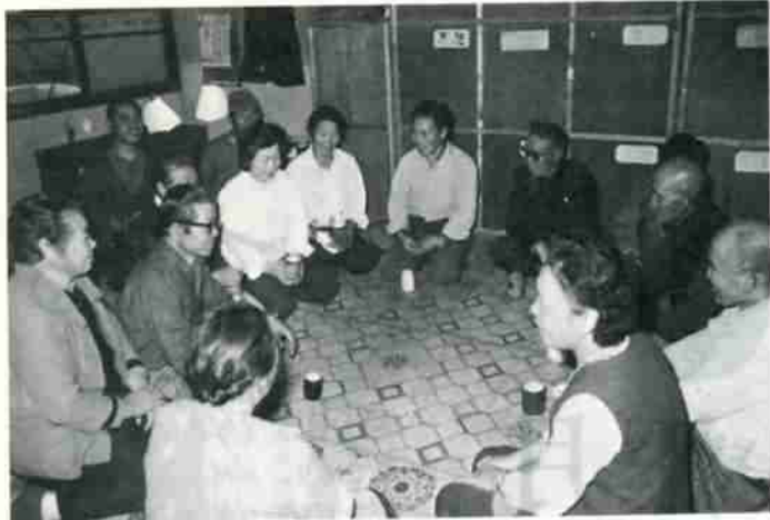
思い出話に花を咲かせる (失対話所の昼休み)

さらに、災害時には側溝のゴミを取り除くために雨ガッパで出勤したり、近くは有珠山噴火での降灰の除去作業に当るなど、その動員力は高く評価されています。