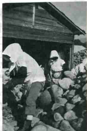
この玉石をくわいて、市道に敷く砂利を作っている (常盤町・クラッシュの現場)

事だったから、寒いのに加えきたないドブ川でね、しかも深いときているものだから、力のない者は道路まで土をハネ上げられなかったものだ。