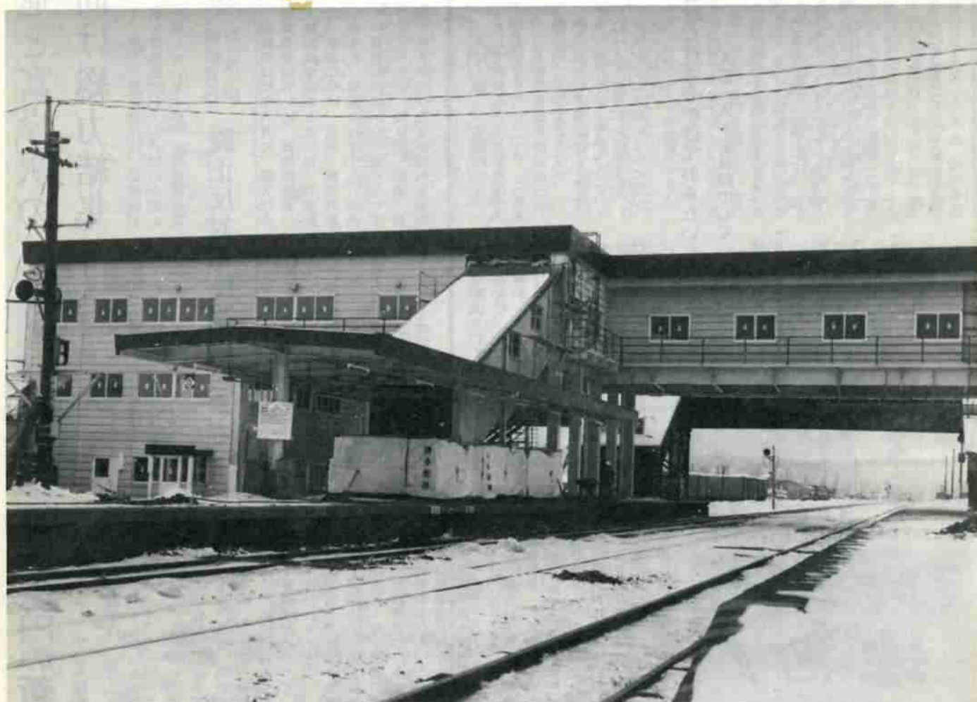
完成間近い新幌別駅舎（2月28日撮影）