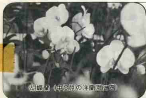
胡蝶蘭（中登別の洋園にて）

市条例によると、例え畜犬であっても、つないでおかない犬は、野犬とみなされるばかりでなく、市民の方からの対策要望もありませんので、放し飼いは野犬とみなし処分しなければなりません。市としても、各地区別に、随時早朝の野犬掃とを行なっていますので、せつかくの愛犬を失なわないよう、つないでおきましょう。