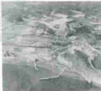
（フシコベツ）登別漁港

ていますが、江戸時代からフシコベツ（古い川）とよばれた地名があり、遠くはポブケナイ（湧とらする・小川）、チャラシナイ（サラサラと音をたてて流れ下る谷川）からも川水が流れていました（登別本町二丁目の山ろくあたり）。