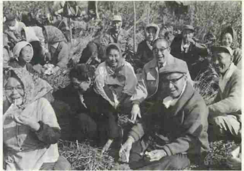
写真は、お年寄りの健康と生きがいづくりとして、昨年実施した老人農園のひとこま。今年度はさらにゆとりのある憩いの場とするほか、栽培品種もふやして実施します。