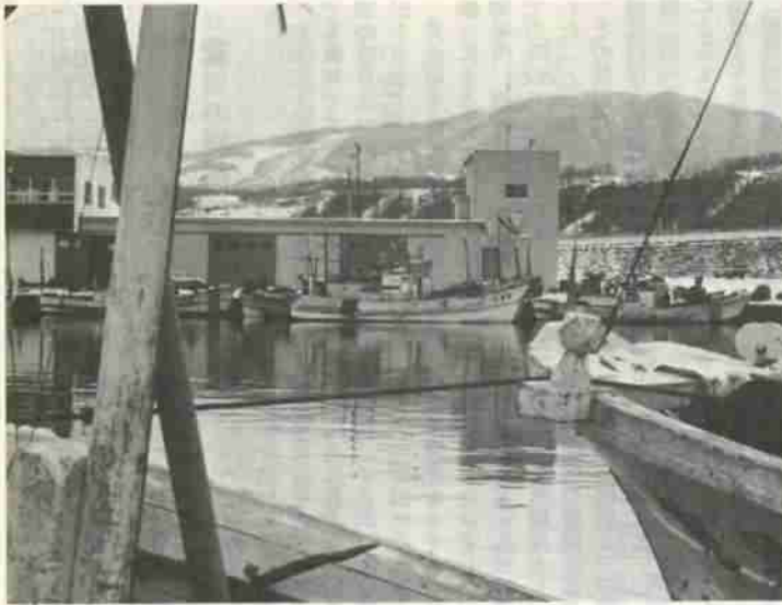
漁業専管水域 200 カイリ時代をむかえ、漁獲の減収は必至の情勢です。生活に直接影響する問題だけに今年度、ホッキ稚魚放流事業をさらに増大するほか、鮭・鱒のふ化調査を進め、たんばく源の確保をはかります。