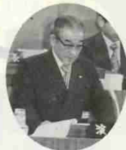
市政執行方針を述べる田村市長