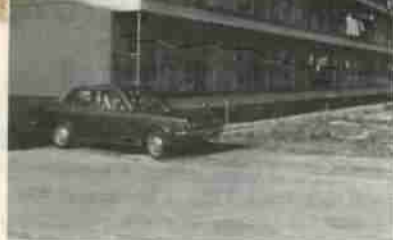
景気浮揚と環境整備のため、公共事業に多額の予算がむけられました。

従って、これが実現の第一歩として国が行うサンシャイン計画の地域指定を受けるよう国に対し強力に働きかけます。