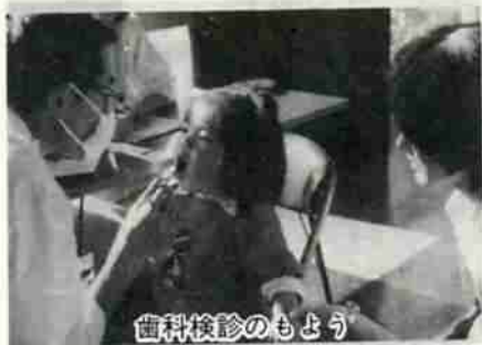
歯科検診のまよう

去る四月九日より六日間にわたり、市内の歯科医師の協力により各地区公民館において、「二歳児歯科検診」が実施されました。この歯科検診は、乳児の生えそろうた二歳児に「虫歯早期発見・早期治療」「虫歯の予防」「精神身体発育における異常の発見」「日常生活習慣の確立」等を目的におこなわれました。