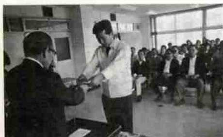
委嘱状を受け取る 新しい指導員