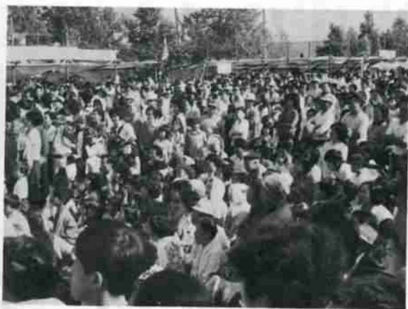
大にぎわいのふるさと広場