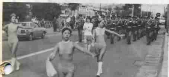
パレードで市民まつりの呼びこみ大成功