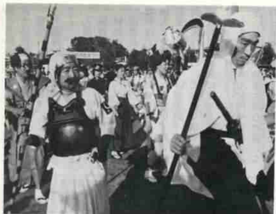
仮装おどりで三重四重の輪にひろまった人の和

こうして、初の市民まつりは午後五時頃まで、くりひろげられ、市民を一堂にあつめて親交を一層深め合い、大成功をおさめました。