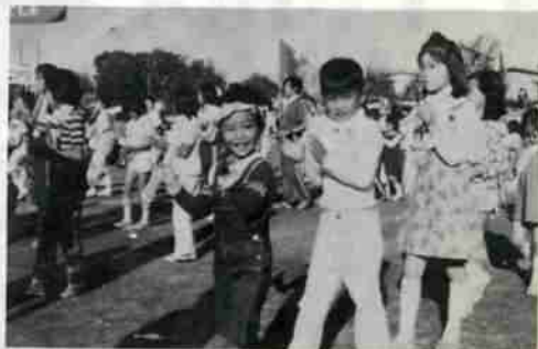
チビッ子にも楽しい一日のおまつりでした