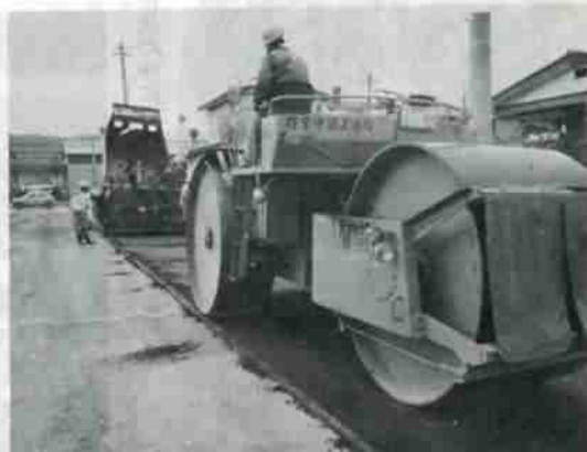
裏通りのすみずみまで進む道路舗装工事