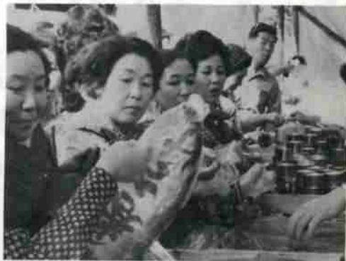
すぐに売りつくした市民サービスコーナー