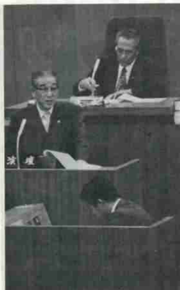
一般質問で答弁に立った市長

オロフレ荘の 利用料金を改正 本年五月に環境庁の国民宿舎利用料金基準が改定され、六月一日から適用できることになっていましたが、カルルス国民宿舎「オロフレ荘」では予約客が八十割も占めていることから、今回の十月一