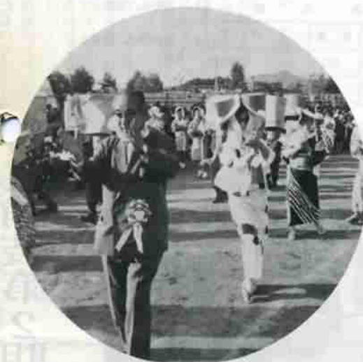
田村市長も市民の中にとけこんで踊りました。