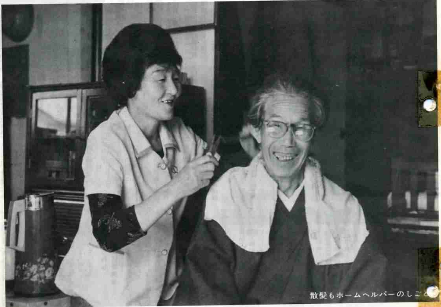
散髪もホームヘルパーのしごと