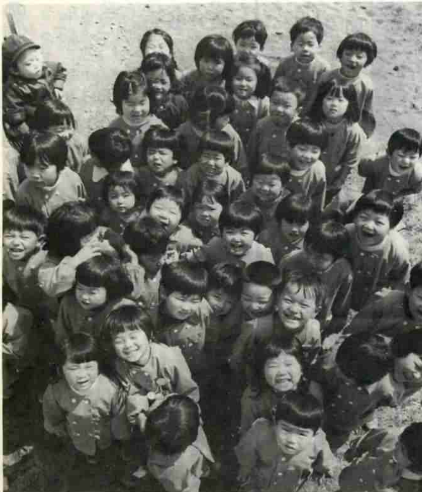
写真は川上保育所の園児たち

さらに、昭和二十五年のこの日「児童憲章」が定められました。内容は、日本国憲法の精神にしたがって児童に対する正しい観念を確立し、すべての児童の幸福をはかろうと、おおよそ三本の柱に要約できましょう。それは、①児童は人として尊ばれ、②社会の一員として、③よい環境のなかで育てられる—ことをうたっております。