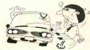
万一のために加入しよう