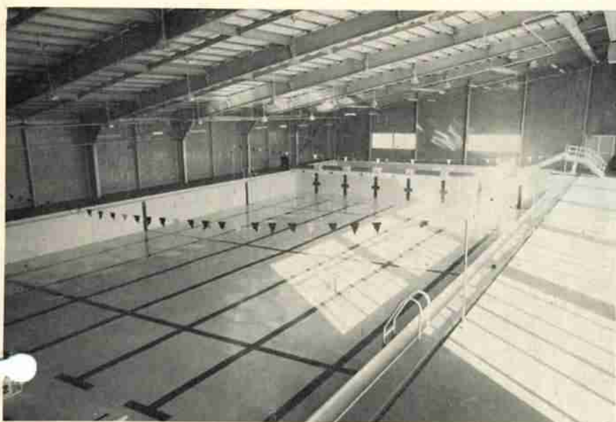
明るく楽しい雰囲気のある室内温水プール。開館はもうすぐです

プールの名称は「登別市民プール」といい、登別市と勤労者の福祉事業を行なっている雇用促進事