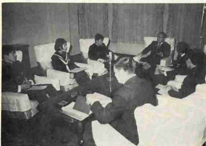
出席者 (写真の位置順)