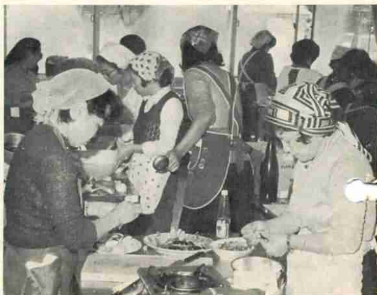
自宅では真剣も出るところですがコンクールとなると真剣そのもの