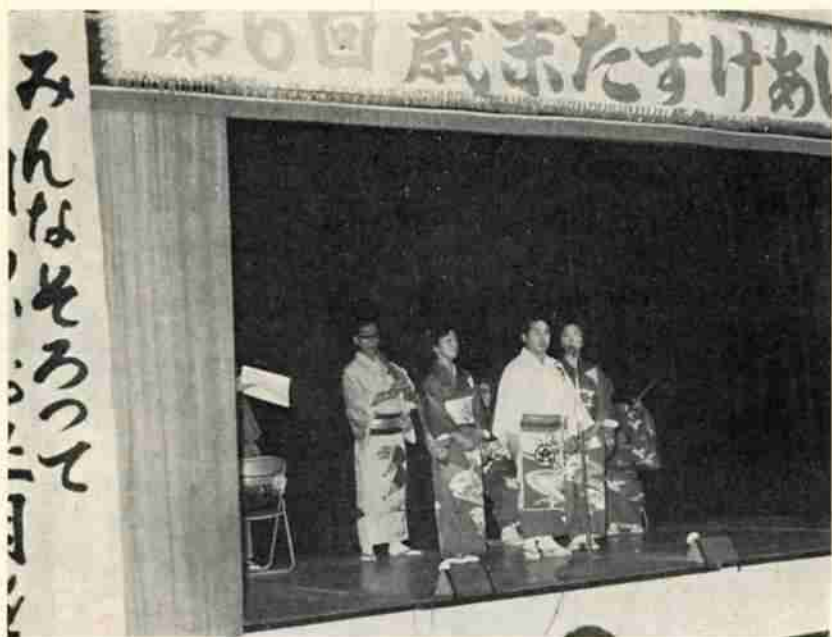
民謡など盛大だった演芸大会

百十人もの出演者は、民謡、舞踊、コーラス、歌謡曲、かくし芸などを披露し、観客の熱烈な応援もあって会場は出演者と観客が一体となって盛り上がり、なごやかな演芸大会となりました。