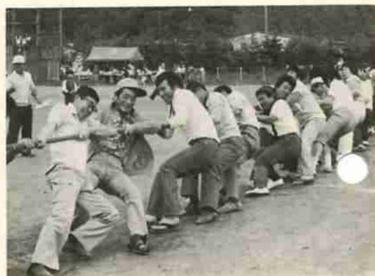
力の入った綱引き競技

市労政課、胆振支庁商工労働課の応援を得て、四十八年度(後期)の技能検定合格者の一級、二級の授与式も合わせて行ない、カラッと晴れ上がった好天のもとで、建築左官、塗装、建具、板金、土木、配管工事、一般の各部会の対抗得点を家族ぐるみで競い合っていました。