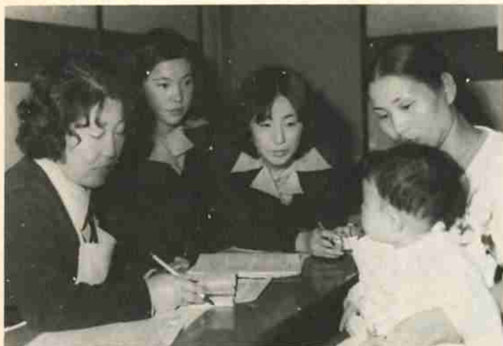
定期的に開いている保健場の育児相談

私たちの生活のなかで、健康は何ものにもまして優先されなければなりません。とくに、生まれて間もない乳児や健康を害しやすいお年寄りの健康管理には、より積極的な行政の手をさしのべる必要があります。そこで今月は、登別市の保健行政に焦点をあわせ、取りあげてみることにしました。