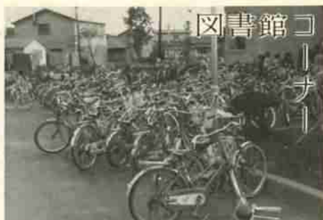
いつでも子供の自転車で いっぱい図書館前