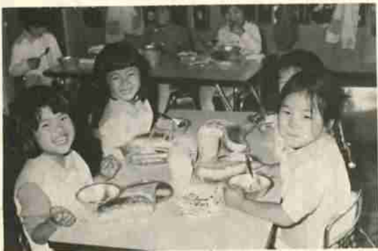
川上保育所の園児たち

今まで、小中学校と同じ献立の保育所の給食は、予算追加で幼児向きの献立に改善し、小中学校の休暇とは関係なく、年間通して給食を届ける予定となっています。