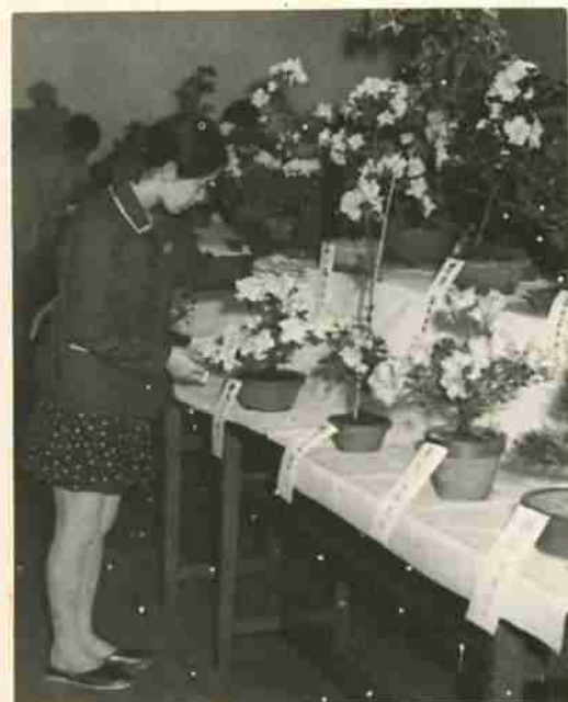
素晴らしい出来ばえのさつき盆栽展