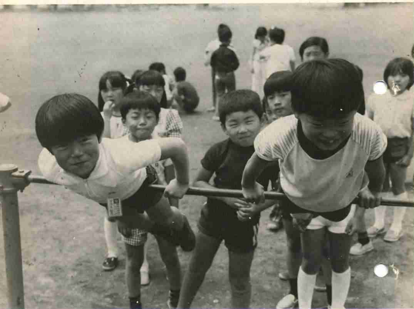
鉄棒で体力づくりの幌小2年生たち