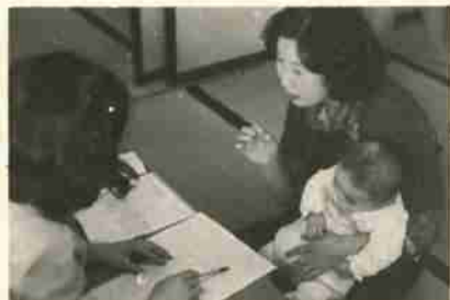
赤ちゃんの健やかな成長こそ市政にとって最も大切な仕事のひとつ

開設し、保健婦三名による妊娠中の病気を予防したり未熟児を出産しないための「妊婦相談」。